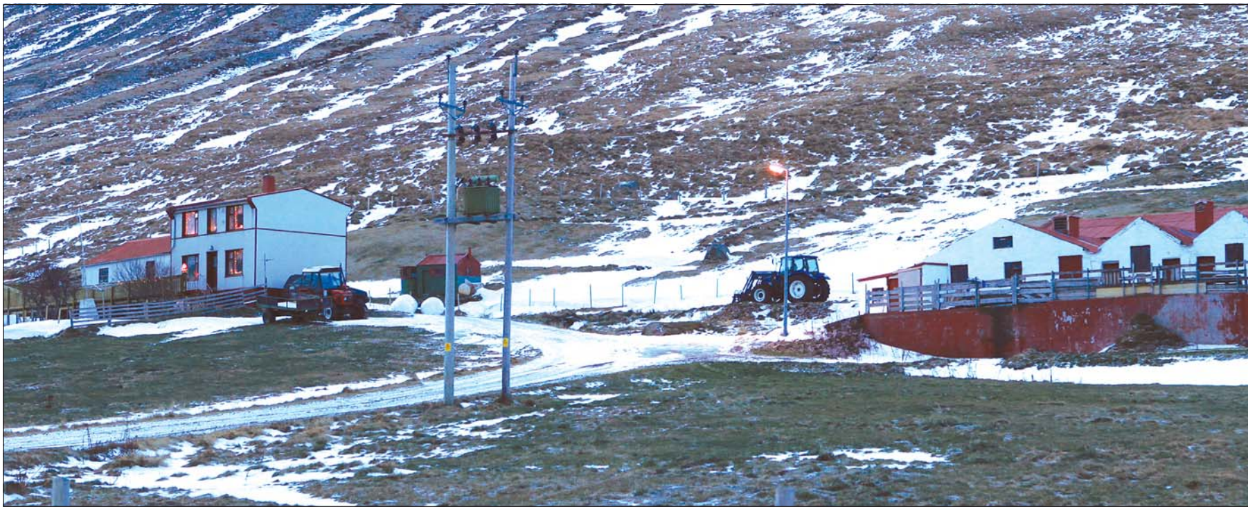
Bærinn Efri-Engidalur í Skutulsfirði.