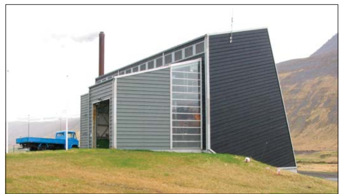
Sorpbrennslan Funa í Engidal.

allan af mælingum á hverjum degi en mælingar eins og þessar eru ekki hluti af þeim. Það er annarra að sjá um þær. En við létum gera þessa mælingu af því að það kom upp þessi spurning frá íbúum. Það er stefna fyrirtækisins að eyða öllum slíkum vafa og niðurstöðan var nóg til þess að grípa til þessara aðgerða.“ Svandís Svavarsdóttir umhverfisráðherra hefur óskað eftir gögnum frá UST vegna málsins. Frá þessu var sagt í Fréttablaðinu.