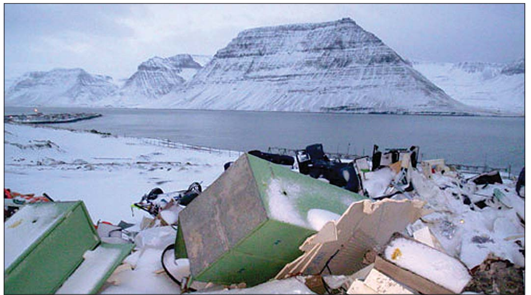
Formaður íbúasamtakanna á Flateyri segir nauðsynlegt að ganga frá gamla urðunarstaðnum við Klofning á Flateyri.