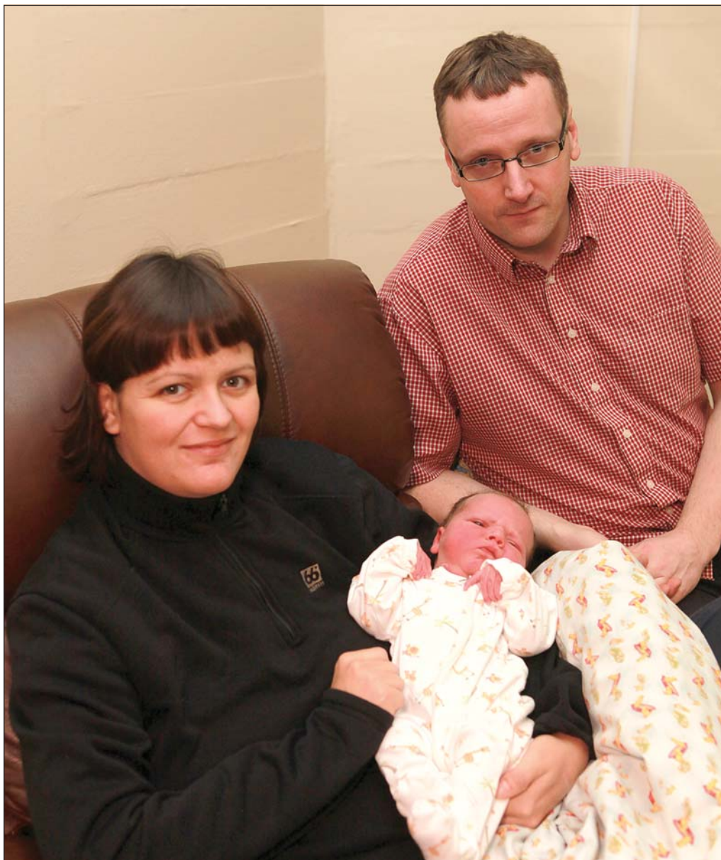
Stoltir foreldrar ásamt nýársbarninu.