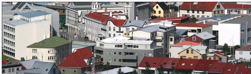
Fasteignir Ísafjarðarbæjar eiga 88 íbúðir á Ísafirði.

ingu á Sjávarbraut ásamt vegriði eða annari vörn. Þá er gert ráð fyrir að aðalsjóður taki 45 milljóna króna langtímalán, sem upphaflega var reiknað með að taka á árinu 2010, til að greiða niður óhagstæðari lán. Þá er reiknað með að hafnarsjóður taki 36 milljóna lán vegna framkvæmda og vegna greiðslu skulda við aðalsjóð. – thelma@bb.is