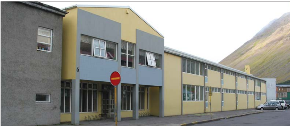
Grunnskólinn á Ísafirði.

grunnskólans í Kaldrananes-hreppi um 2,6 milljónir króna og um rúmar 300 þúsund krónur vegna grunnskólans í Árnes-hreppi. Hins vegar er gert ráð fyrir að úthlutun vegna rekstrar grunnskólans á Tálknafirði lækki um 1,5 milljónir króna og verði 27,7 milljónir á árinu 2012.