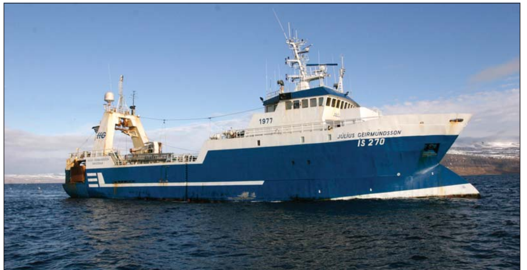
Frystitogarinn Júlíus Geirmundsson ÍS.

Veiðin hjá öðrum skipum HG var þokkaleg á árinu. Valur ÍS hefur verið á veiðum í Ísafjarðardjúpi. „Hann á svolítið eftir af kvóta og verður áfram á rækjuveiðum fram á nýja árið. Veiðin í Djúpinu hefur verið góð og fáheyrt að menn hafa verið að veiða svona vel. Hins vegar liggur óvissan um framtíð kvótakerfisins eins og mara á okkur og af þeim sökum er allt í biðstöðu hér líkt og hjá flestum öðrum fiskvinnslufyrirtækjum í landinu.