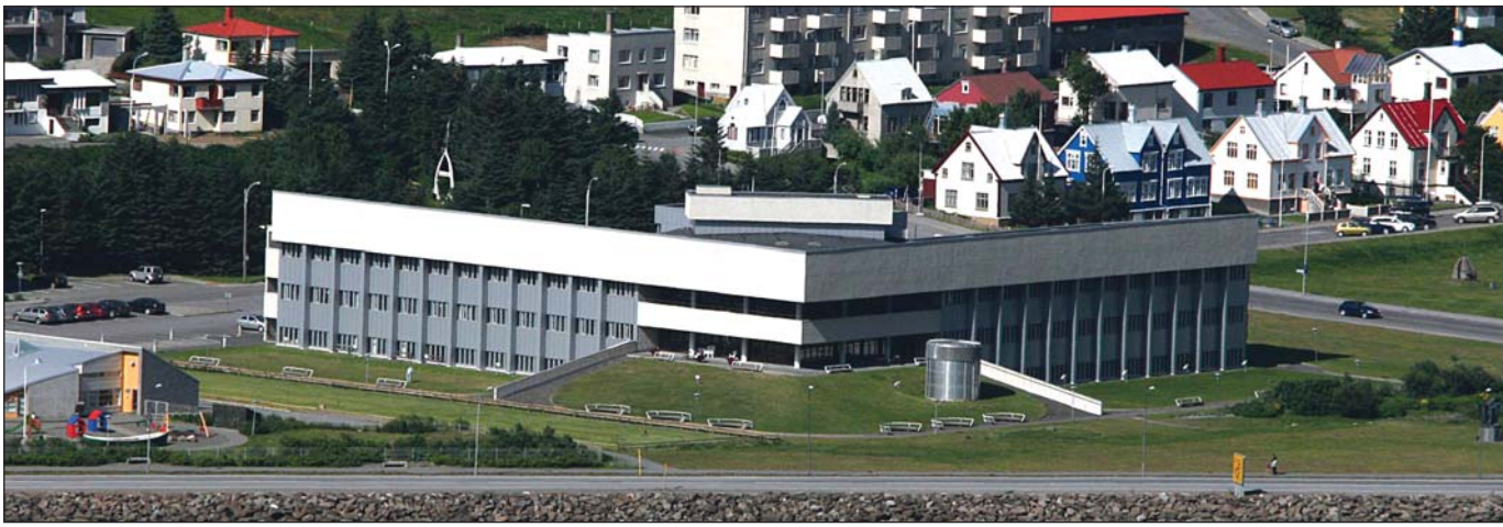
Heilbrigðisstofnun Vestfjarða á Ísafirði.