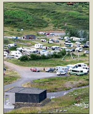
Tjaldsvæðið í Tungudal.