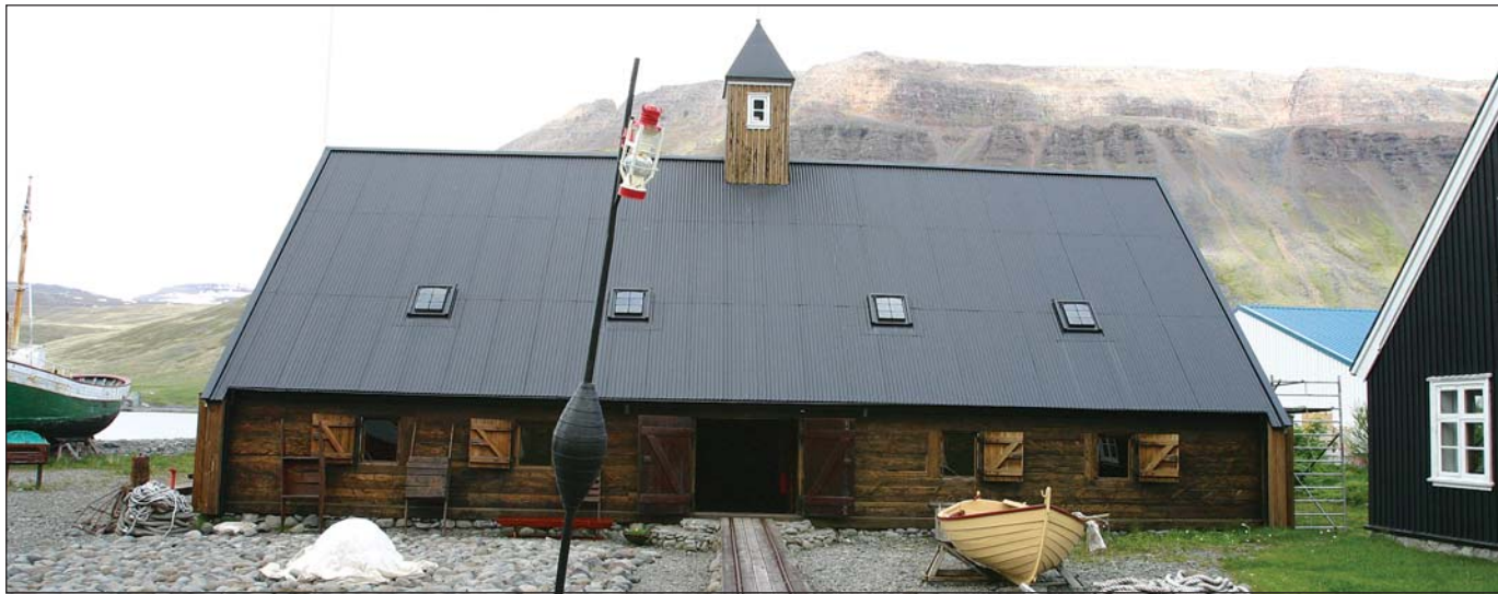
Byggðasafn Vestfjarða í Neðstakaupstað á Ísafirði.