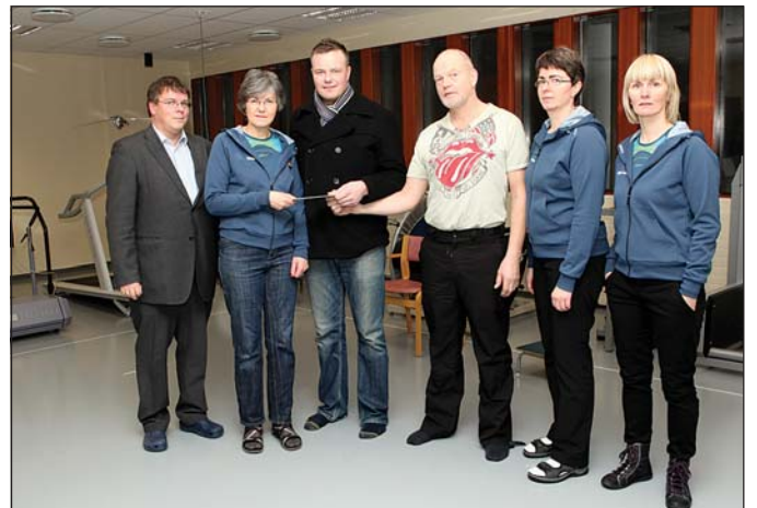
Frá afhendingu gjafarinnar.