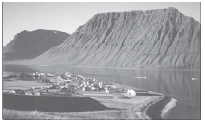
Frá Flateyri þar sem um 60 Grænendingar munu halda hátíð ásamt heimamönnum 10. –13. júlí.

Auk þess að koma fram á Flateyri munu grænlenksku