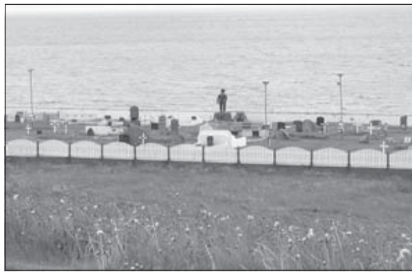
Kirkjugarðurinn í Hnífsdal.

Miðað er við að framkvæmdir geti hafist sem fyrst og að þeim verði lokið