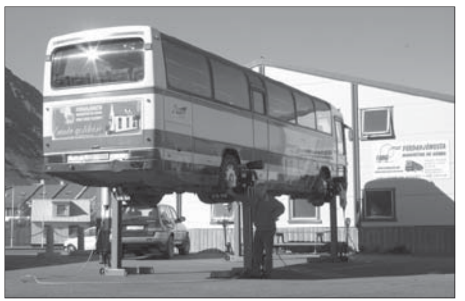
Bílalyfta FMG er augljóslega nokkuð öflug.

að koma athugasemdum og ábendingum til nefndarinnar sem fyrst.