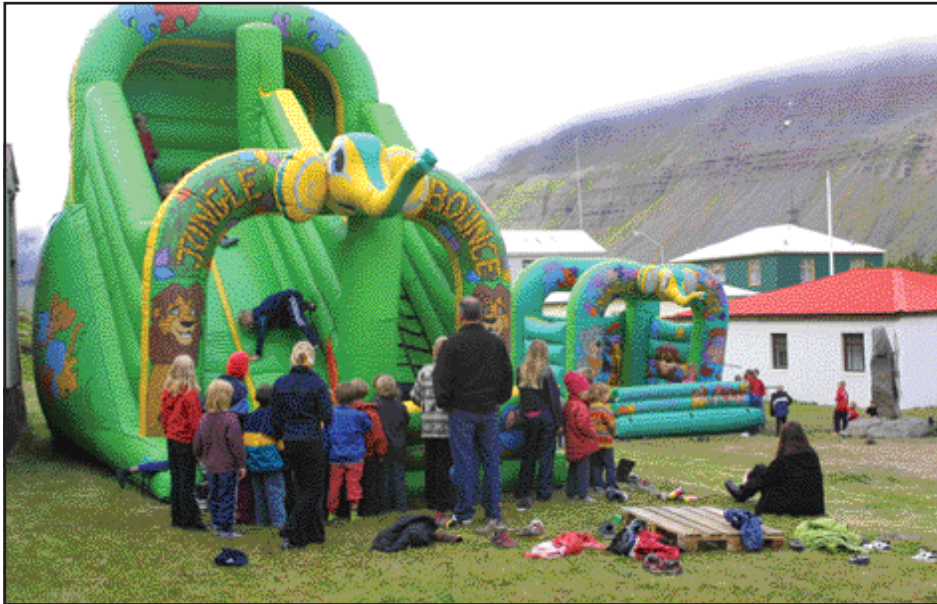
Hoppikastalinn vakti mikla kátínu meðal yngri gestanna á sæluhelginni.