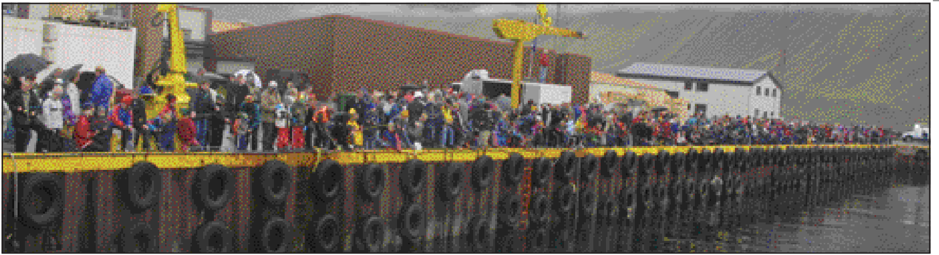
Hafnarkanturinn á Suðureyri var þéttsetinn á meðan á mansakeppninni stóð.