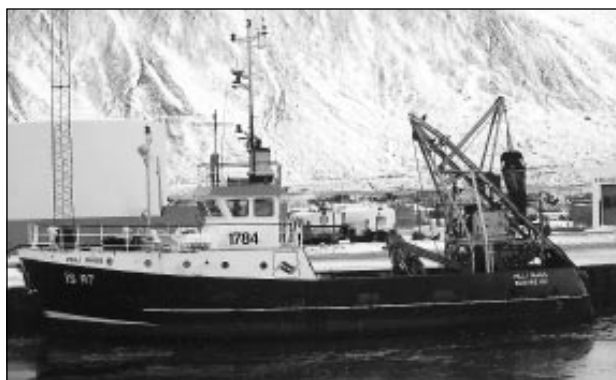
Vestfirskur skelfiskur hf., á Flateyri er um þessar mundir að festa kaup á nýju skipi í stað Æsu ÍS sem fórst í Arnarfirði á síðasta ári. Ráðgera stjórnendur fyrirtækisins að vinnsla geti hafist að nýju í apríl.

Ráðgert er að gera nauðsynlegar breytingar á skipinu og er kostnaður við kaupin og breytingarnar áætlaður um 90-100 milljónir króna.