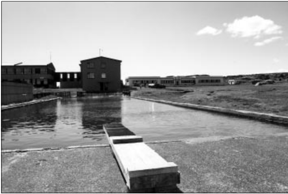
Reykjanes við Ísafjarðardjúp

Auglýsingasími Bæjarins besta er 456 4560