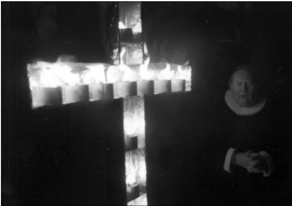
Frá minningarathöfninni sem haldin var í Súðavík fyrir ári síðan.

við grunna þeirra húsa sem eyðilögðust í flóðinu. Þá var haldið að auðu svæði við pósthúsið í Súðavík, þar sem fram fór bænastund og látinna var minnst. Síðar um kvöldið fór fram minningarstund í Súðavíkirkirkju sem og í Dómkirkjunni í Reykjavík.