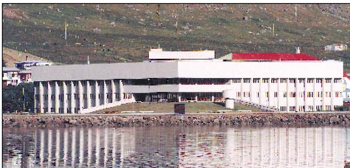
Fjórðungssjúkrahúsið á Ísafirði. Læknar þaðan hafa þjónað Bolvíkingum frá því héraðslæknir hætti þar störfum.