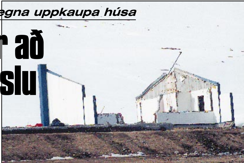
Frá Súðavík. Súðavíkurreppur tók á sig 37 milljónir króna um áramót vegna uppkaupa húseigna í gömlu Súðavík. Hreppurinn ráðgerir að sækja um fyrirgreiðslu til Ofanflóðasjóðs til að geta gert upp við húseigendur á staðnum.

„Þeir aðilar hjá hinu opinbera sem ég hef átt erindi við vegna þessa máls hafa hengt sinn hatt á lagabreytinguna á frumvarpinu um varnir gegn