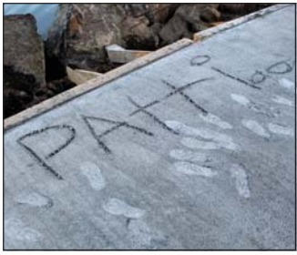
Áletrun og fótspor í steyptri skábraut við Ísafjarðarhöfn.