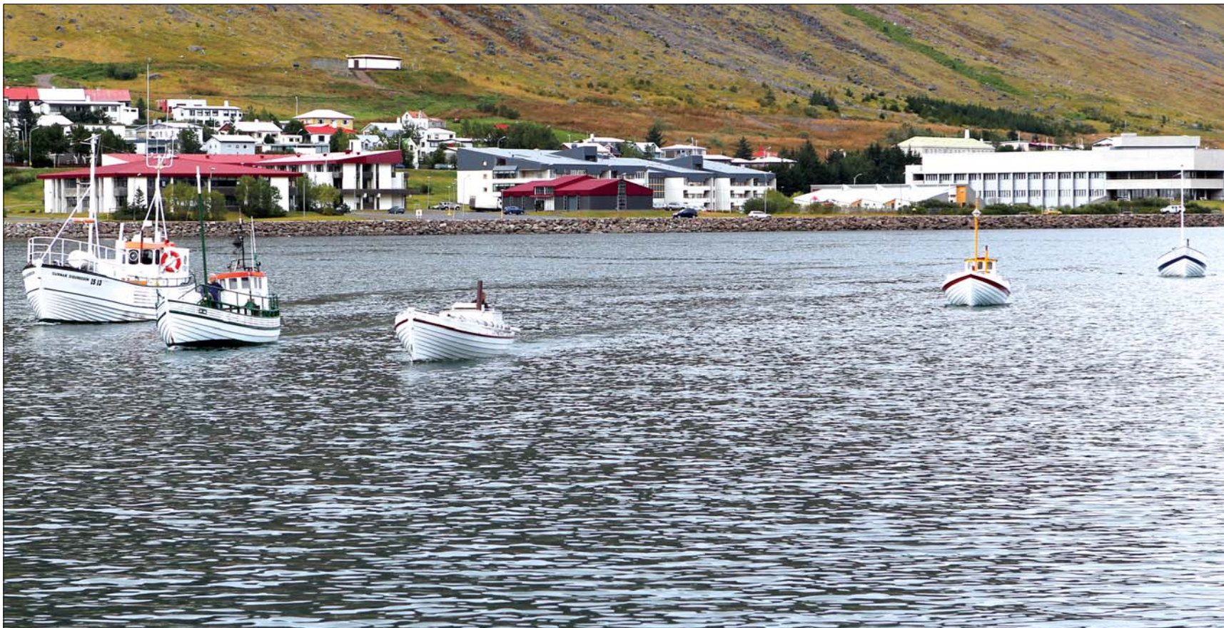
Sjöhæfir bátar Byggðasafns Vestfirðna sigla á Pollinum.