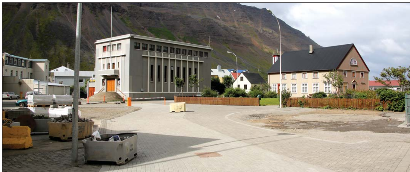
Vinna við gröft og lagningu regnvatnslagna ásamt hellulögn við Aðalstræti og Austurveg á Ísafirði er nú á lokametrunum.