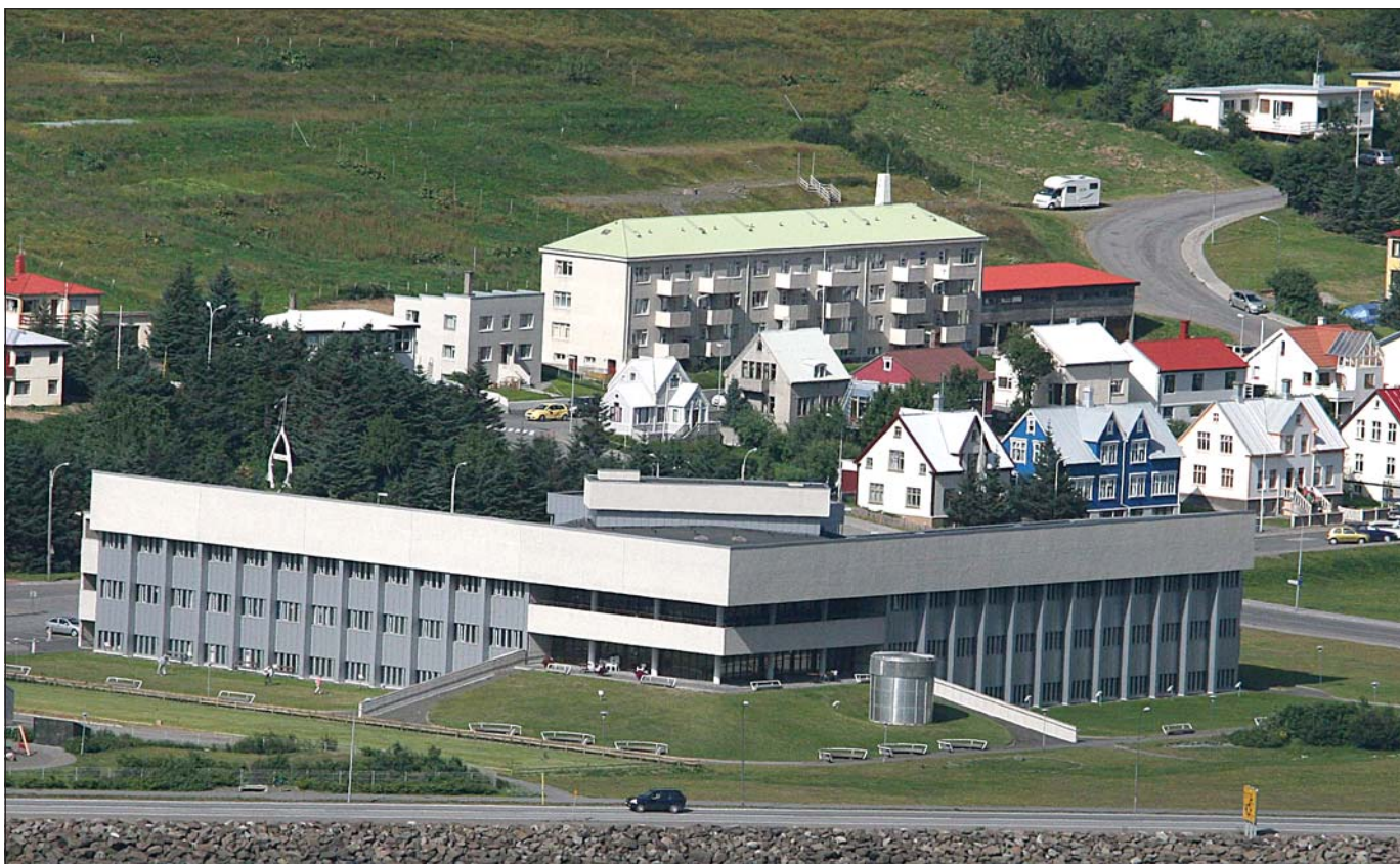
Fjórðungssjúkrahúsið á Ísafirði er stærsta eining nýrrar stofnunar.