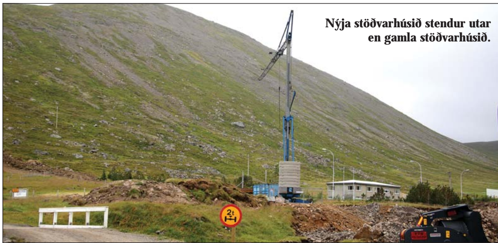
Nýja stöðvarhúsið stendur utar en gamla stöðvarhúsið.