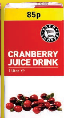
Eplasafi, 1 L Trönuberjasafi, 1 L