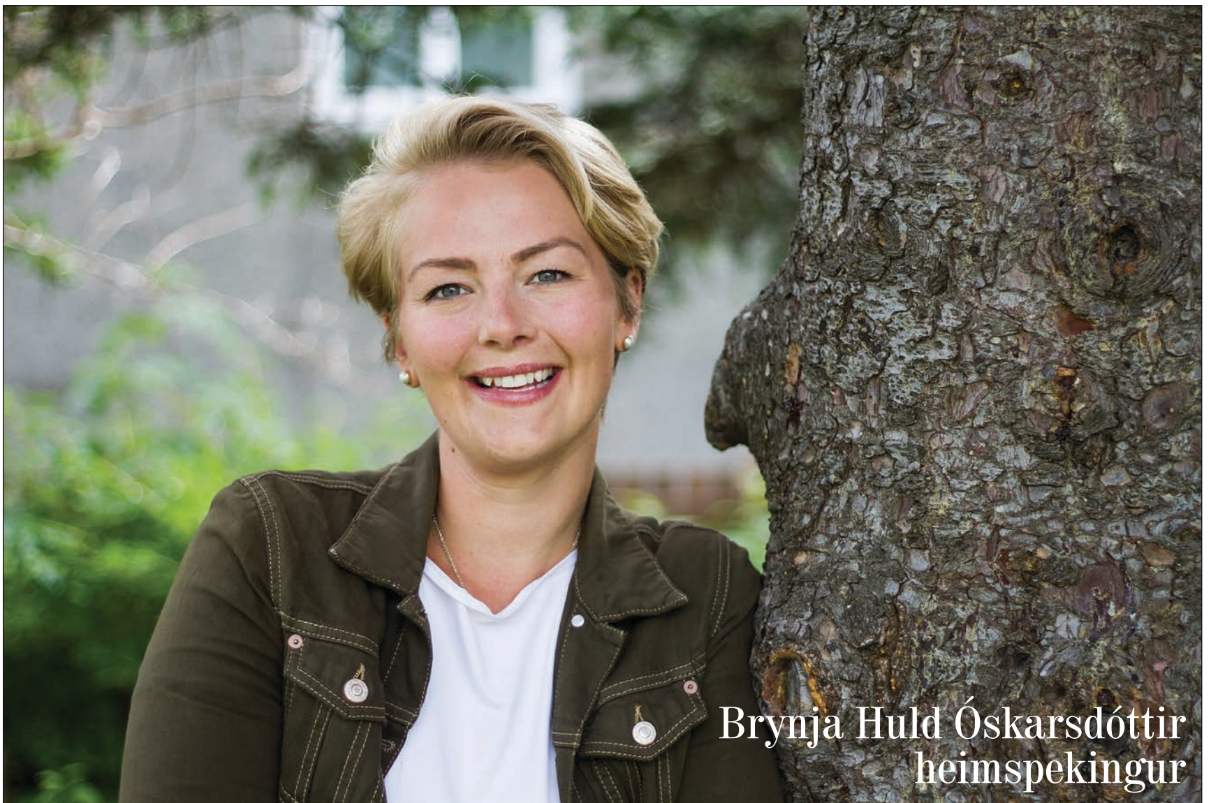
Brynja Huld Óskarsdóttir heimspekingur