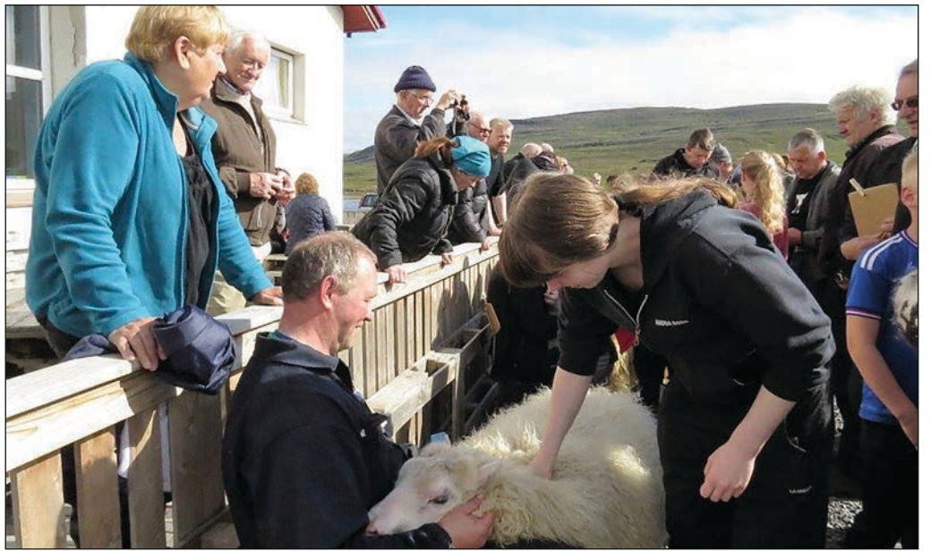
Íslandsmeistarinn þuklar og dæmir hrút á mótinu.