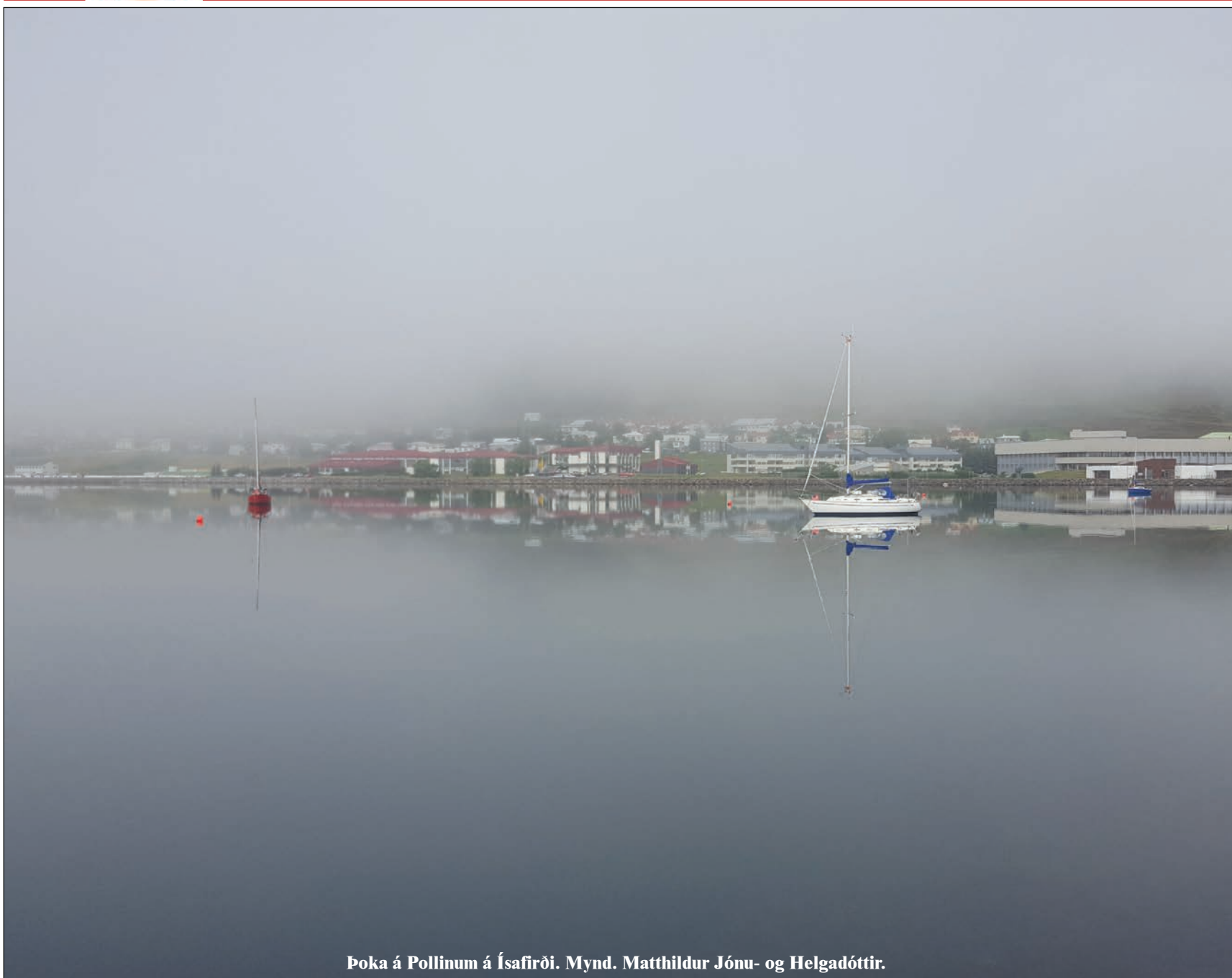
Þoka á Pollinum á Ísafirði.

Stofnað 14. nóvember 1984 · Fimmtudagur 25. ágúst 2016 · 31. tbl. · 33. árg. · Ókeypis eintak