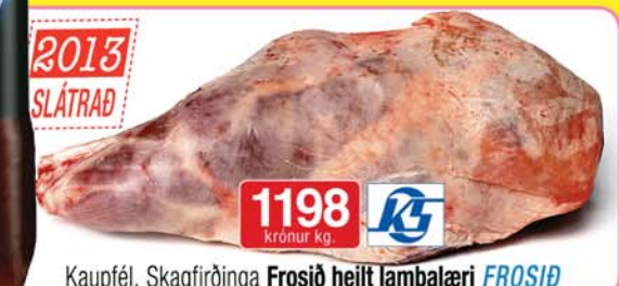
Kaupfél. Skagfirðinga Frosið heilt lambalæri FROSID