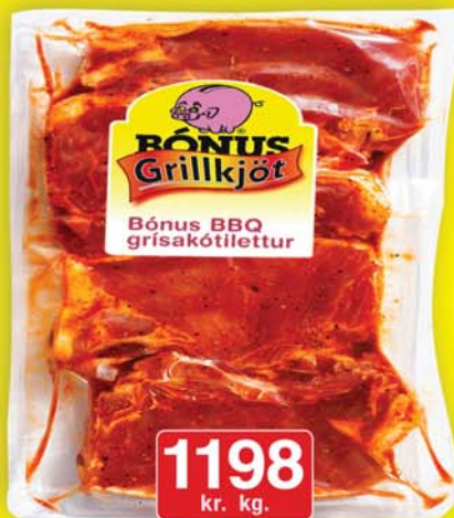
Bónus BBQ grill grísa kótilettur