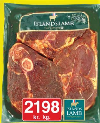
Grill lambalærissneiðar 1.FLOKKUR