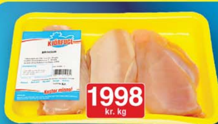
Kjörfugl ferskar kjúklingabringur