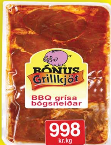
Bónus BBQ grill grísa bógsneiðar