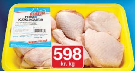
Kjörfugl ferskir blandadir kjúklingabitar