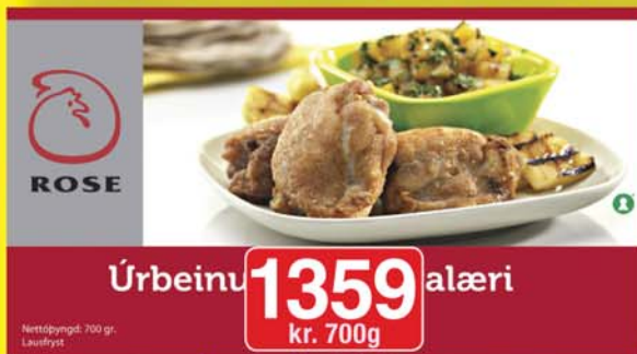
Rose Úrbeinuð kjúklingalæri 700g