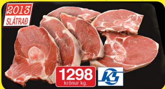
KS Lamba-Sirloinsneiðar FROSINAR