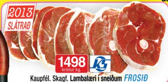
Kaupfél. Skagf. Lambalæri í sneiðum FROSID