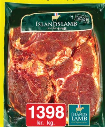
Grill lamba-sirloin sneiðar