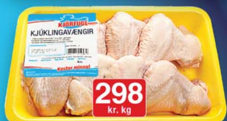
Kjörfugl ferskir kjúklingavængir