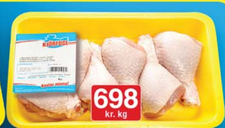
Kjörfugl ferskir kjúklingaleggir