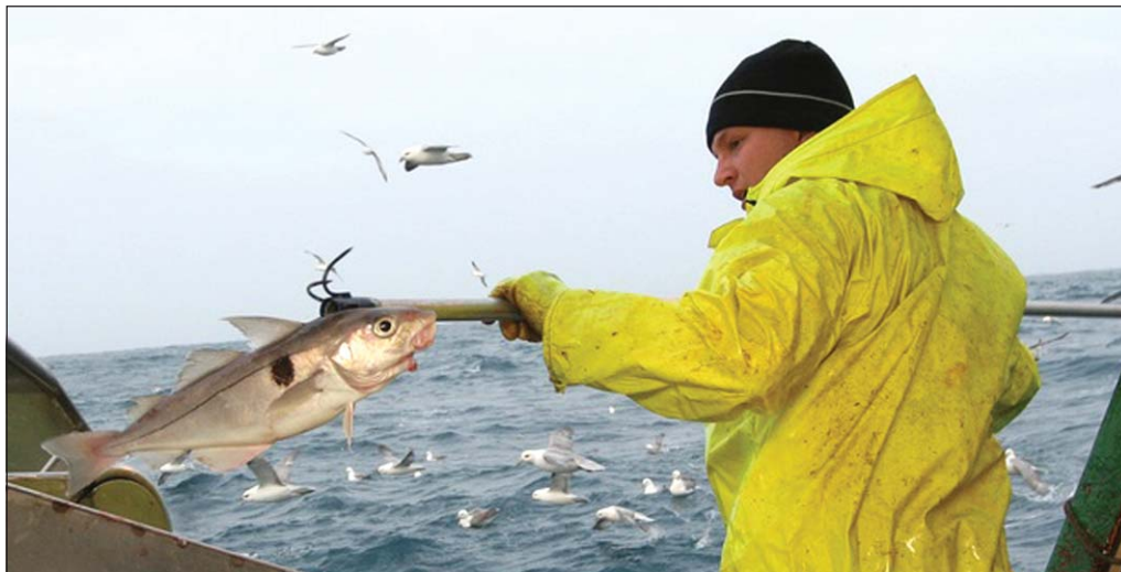
Með stærðarhagkvæmni og jákvæðri ímynd Vestfjarða vonast fyrirtækin til að afla sér nýrra markaðssvæða fyrir sjávarafurðir.