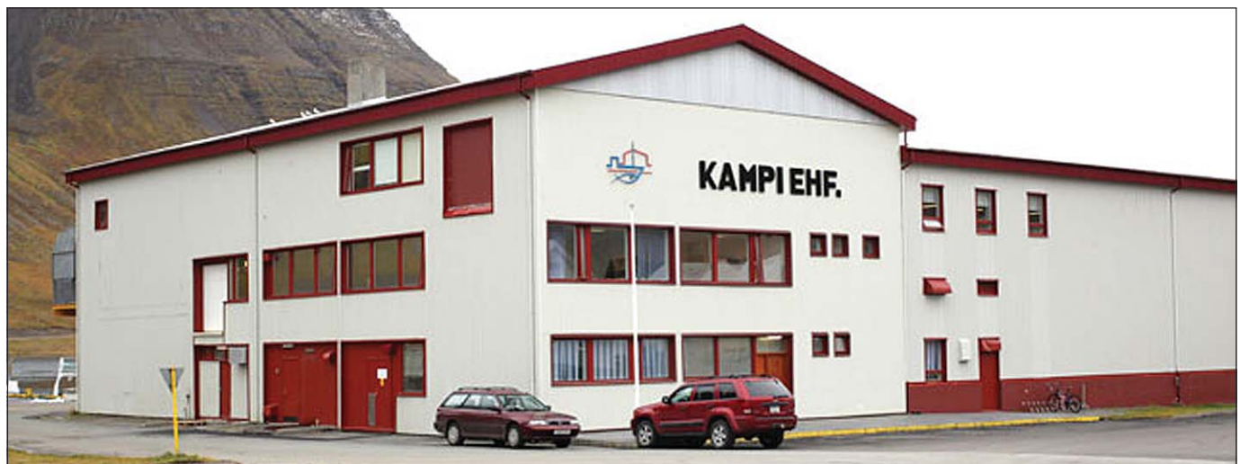
Kampi er með stærri vinnuveitendum á Ísafirði.