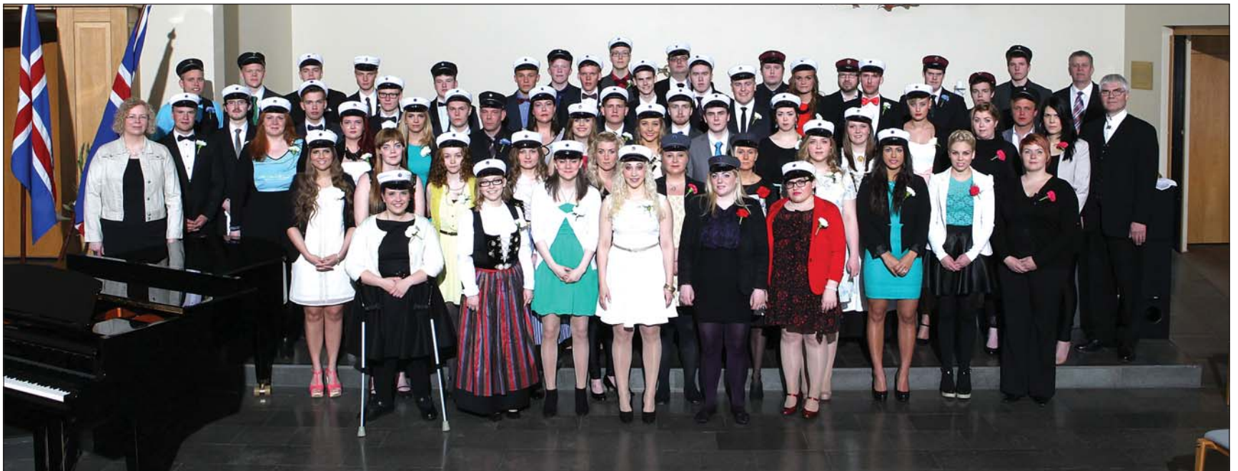
Sextíu og sjö nemendur útskrifuðust frá Menntaskólanum á Ísafirði á laugardag.