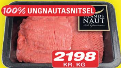
2198 KR. KG