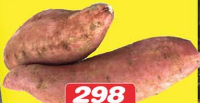
298 KR. KG