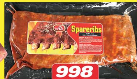
998 KR. KG

FULLELDUÐ RIF, ÞARF AÐEINS AÐ HITTA ALI GRÍSA SPARERIBS