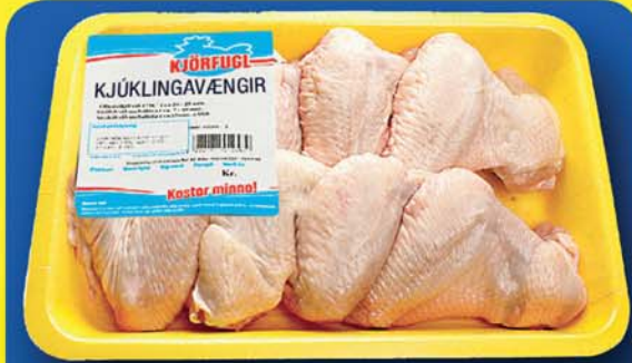
Vængir 279 kr.kg