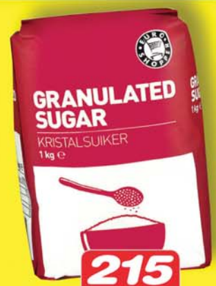
215 KR. KG EUROSHOPPER SYKUR 1 KG Eigum birgðir sem bera ekki nýja sykurskattinn