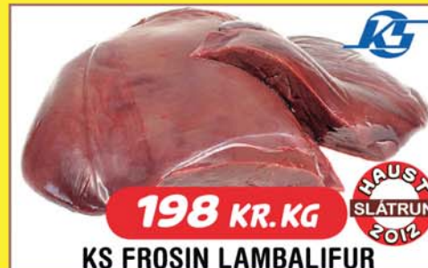
198 KR. KG