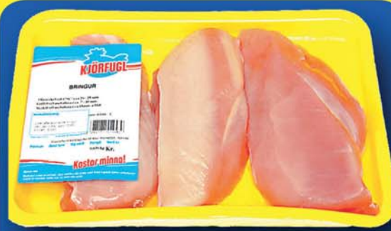
Bringur 1979 kr.kg