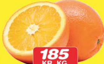
185 KR. KG