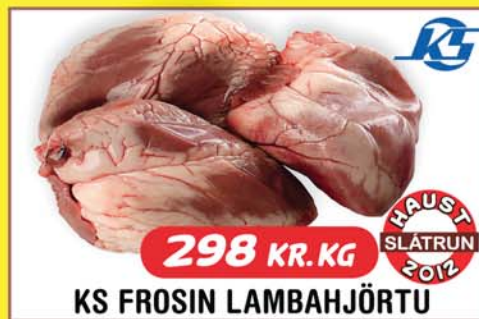
298 KR. KG