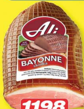
1198 KR. KG