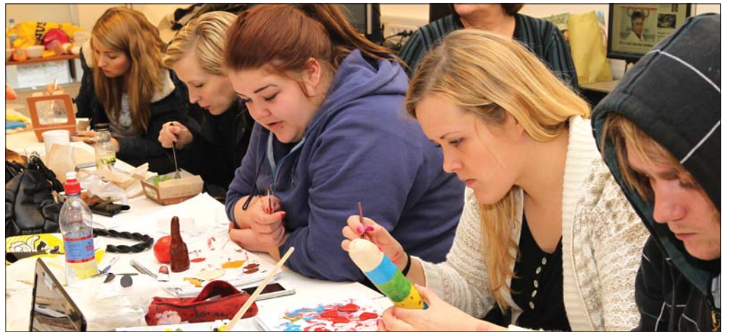
Vestfirski skatan var þema smiðjunnar.

Minjastofnun Íslands, Suðurgötu 39, 101 Reykjavík.