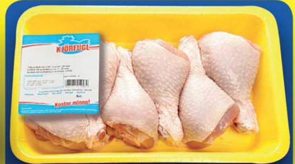
Leggir 695 kr.kg