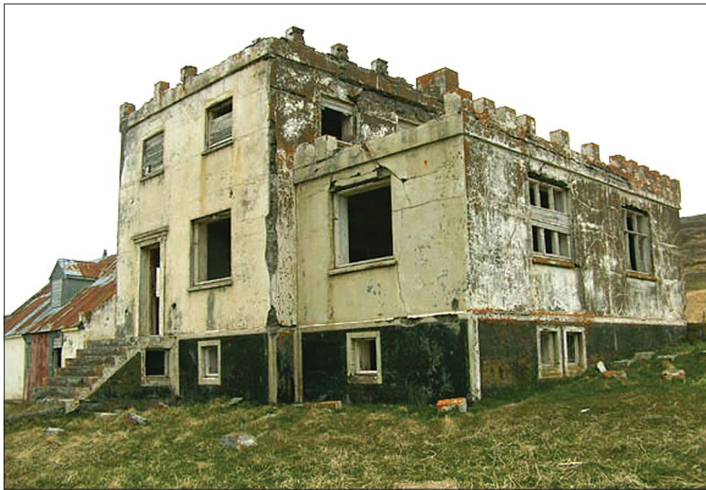
Arngerðareyri í Ísafirði er líklega eitt af þeim eyðibýlum sem skráð verða í verkefninu Eyðibýli á Íslandi.

Tannlæknafélag Íslands mælir með notkun xylytols sem aðalsætuafnis í tyggigúmmil