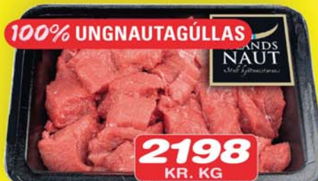
2198 KR. KG