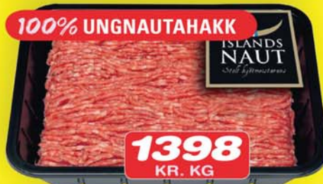
1398 KR. KG