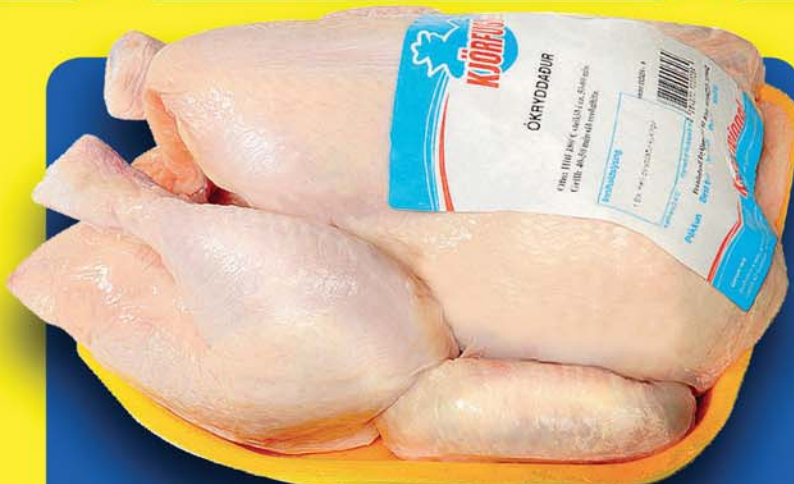
Heill ferskur 759 kr.kg