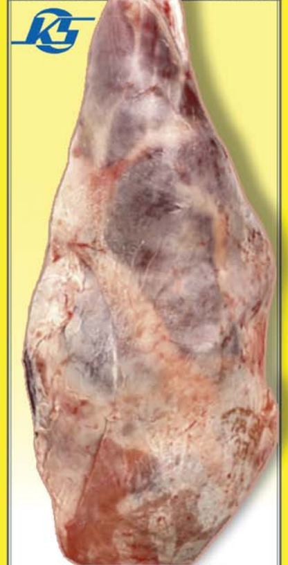
1195 KR. KG