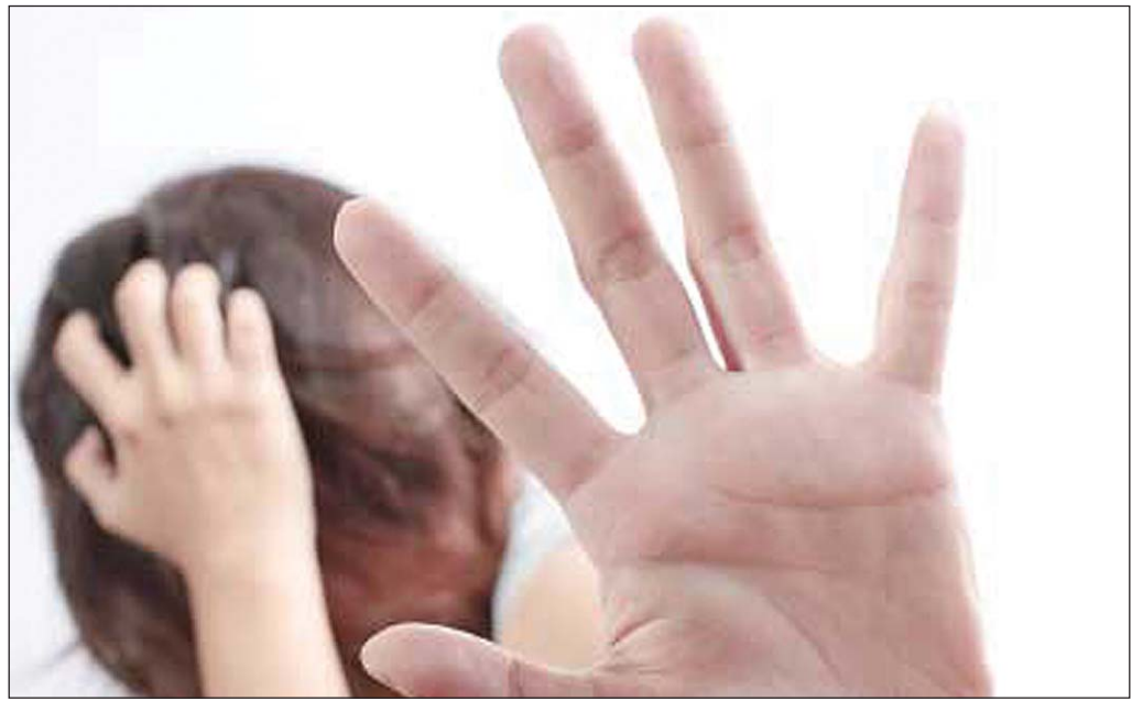
Hátt hlutfall svarenda sögðust hafa orðið fyrir kynferðislegu ofbeldi.

„Sem foreldrar getum við lagt áherslu á að eiga í góðum og opnum samskiptum við börnin okkar. Einnig verðum við að horfast í augu við þá staðreynd að í flestum tilvikum er gerandinn nákominn fjölskyldu þolanda, einhver sem þolandi treystir, og að ofbeldið á sér oft stað inni á heimili annað hvort gerenda eða þolanda. Tölum við foreldra vinarins ef barnið okkar biður um að fá að gista þar. Hversu vel þekkjum við þá? Verða fleiri en einn fullorðinn einstaklingur heima? Segjum þeim að barnið eigi að fá að hringja í okkur hvenær sem það vill. Ef við erum