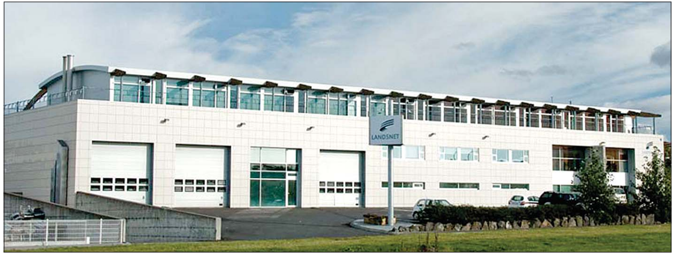
Landsnet framkvæmir fyrir um þrjá milljarða á Vestfjörðum sem er meira en veitt er til annarra svæða.

Dæmi um þau verkefni sem Landsnet hefur unnið að undanfarin ár og ljúka á við á næsta ári eru lagning 66 kV jarðstreng milli Bolungavíkur og Ísafjarðar, bygging nýrrar spennistöðvar utan snjóflóðasvæða á Ísafirði, bygging nýrrar spennistöðvar