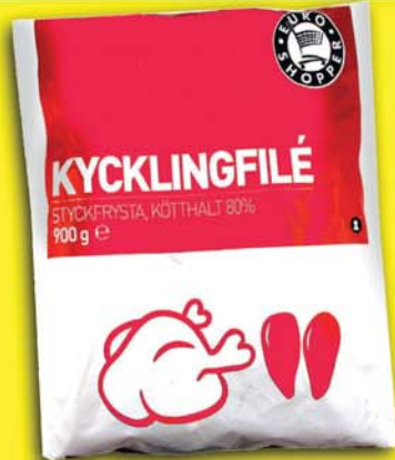
ÓDÝRUSTU FROSNU KJÚKLINGA-BRINGURNAR 1579 KR. 900 GR Í BÓNUS