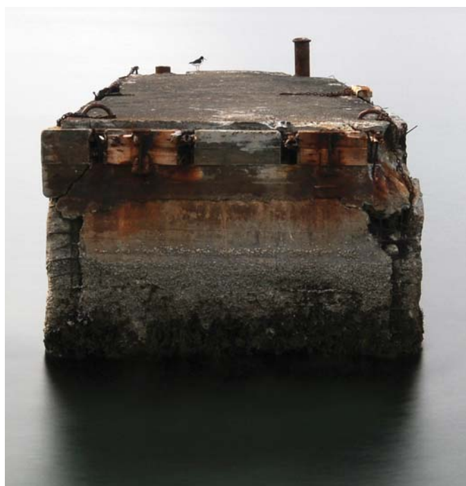
Gamla bryggjan við Arngerðareyri.

N2000 (sem ég man eftir). Skemmtilegasta Kóðak mómentið? Þegar ég fékk hringingu frá vinnufélaga um norðurljósadýrð í Önundarfirði og náði loksins norðurljósamyndum. Hvað er í dótakassanum? Myndavél: Nikon D300. Linsur: Sigma 10-20, Nikon 18-70 Nikon 35 og Nikon 50. Þrífótur og 10 stoppa filter. Á hvern skorar þú? Kára Þór Jóhannsson.