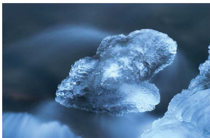
Tekið þegar farið var að rökkva, af klaka ofan á steini í læk.