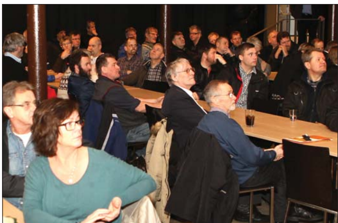
Fjöldi manns sótti fundinn.

Að loknum erindum þremminganna var opnað fyrir fyrirspurnir og voru þær margar og mestmegnis á jákvæðum nótum en þó mátti greina á fundinum áhyggjur fólks af áhættu vegna sjúkdóma sem berast í villta stofna og áhrif eldis á botnlífríki undir kvíunum. – smari@bb.is