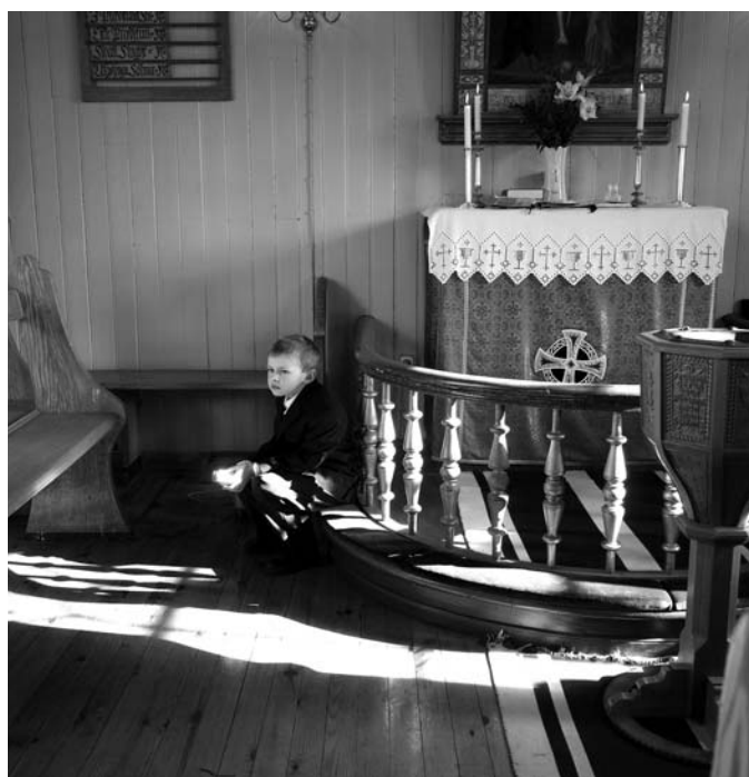
Ungur strákur sem dró sig afsíðis í skírn bróður síns, friðsæll og íbygginn á svip.