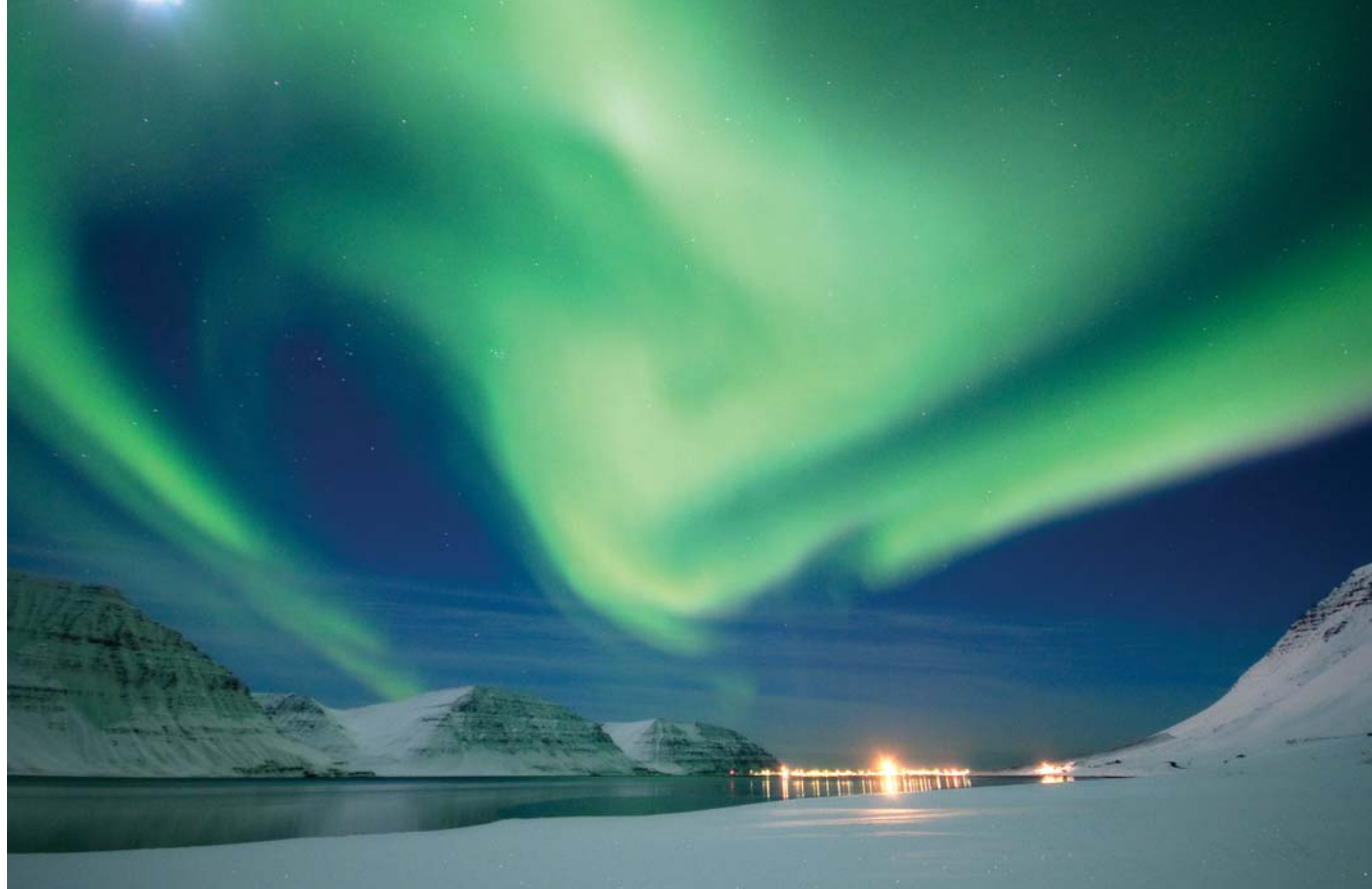
Norðurljósadýrð í Önundarfirði. (Kóðak mómentið mitt).