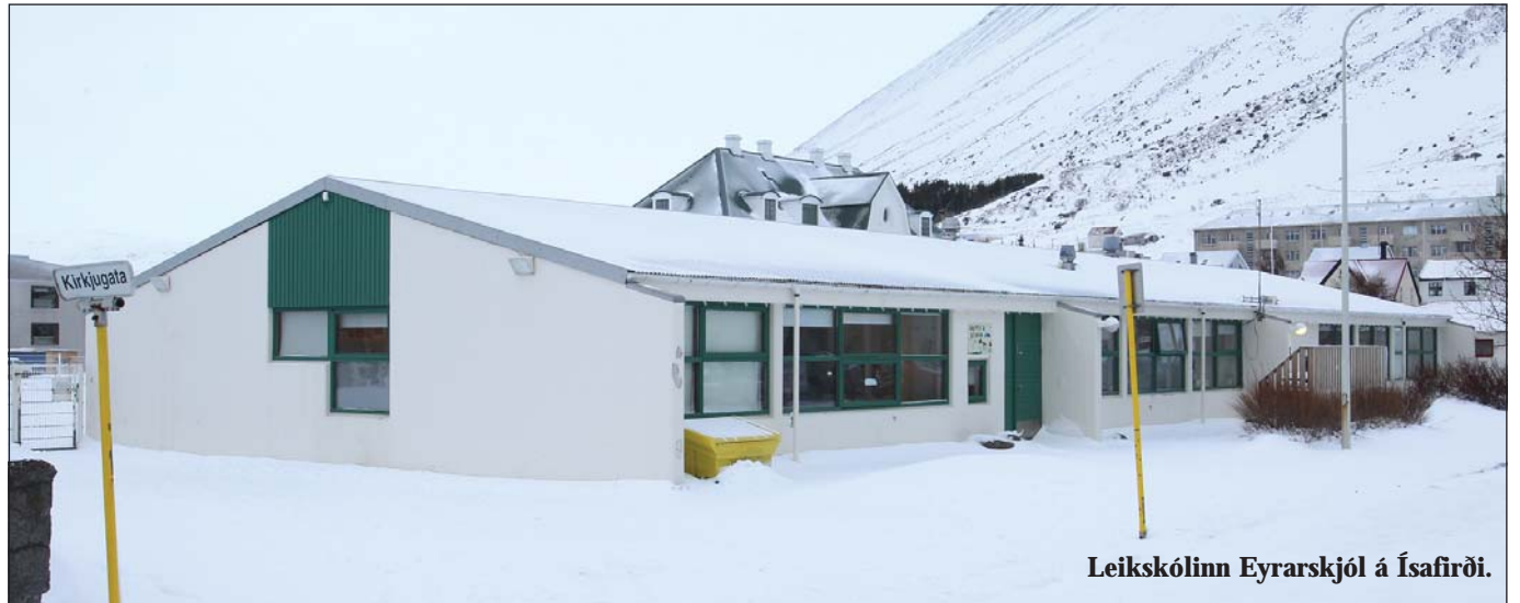
Leikskólinn Eyrarskjól á Ísafirði.