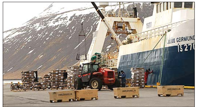
Aflaverðmæti Júlíusar var 1.667 milljónir á síðasta ári.