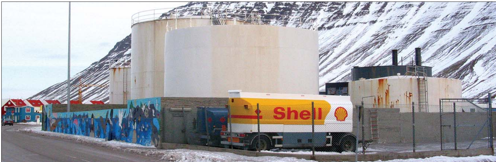
Hluti tankanna voru færðir yfir á Mávagarð en einhverjir eru eftir auk annarra mannvirkja.