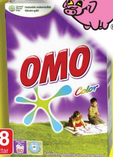
OMO ÞVOTTAEFNI 80 ÞVOTTAR