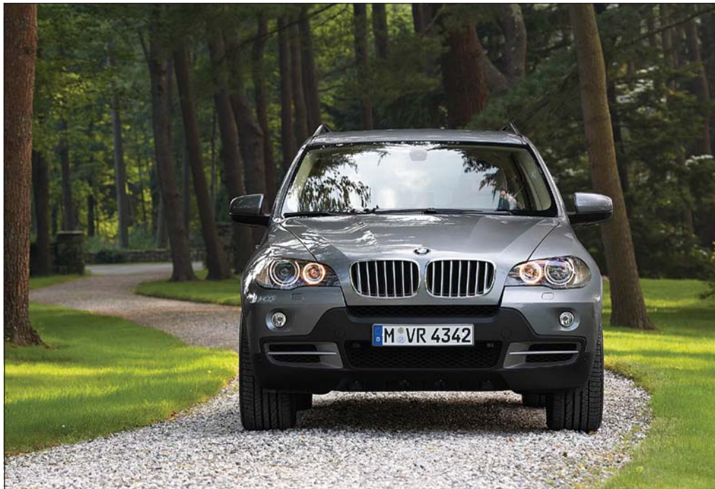
Vanrækslugjöld vegna óskodaðra ökutækja skiluðu yfir 238 milljónum í ríkissjóð á síðasta ári en þá var í fyrsta sinn tekið hart á bifreiðaeigendum sem vanræktu að fara með bifreiðar sínar til skoðunar á réttum tíma.