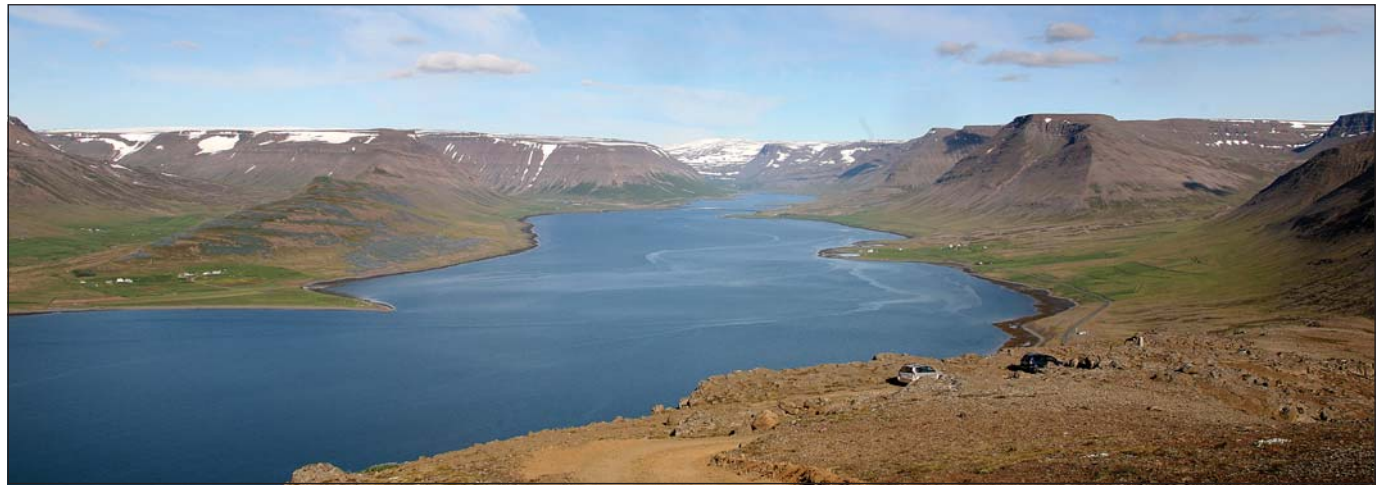
Ísafjarðarbær hyggst ekki leggja gegn umbeðnu rannsóknarleyfi Íslenska kalkpörungafélagsins ehf, um leitar- og rannsóknaleyfi á kalkpörungasetri í Dýrafirði, Tálknafirði og Patreksfirði að uppfylltum ákveðnum skilyrðum.

Halldór segir í umsögn bæjarráðs að af hálfu Ísafjarðarbæjar sé gerð sú krafa að ef vinnanlegt