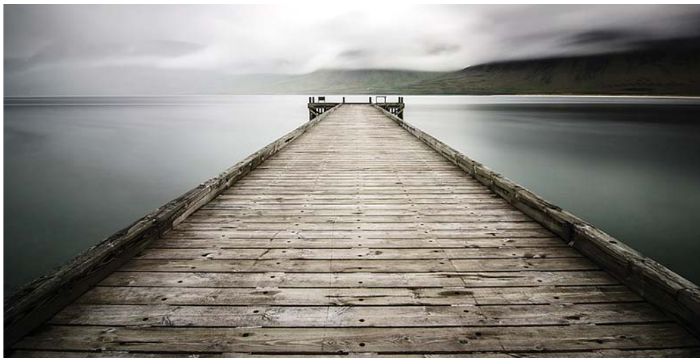
Holtsbryggja í Önundafirði: Þessi mynd er tekin á 30 sek. með 10 stoppa filter.