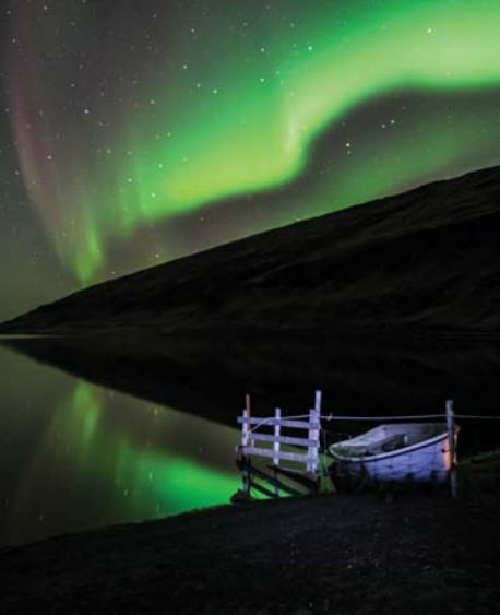
Norðurljós í Haukadal.