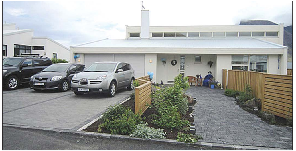
Á þessari mynd má sjá Holtastíg 15 í Bolungarvík, en ásett verð þessa 417 m 2 einbýlishúss er tæpar 35 milljónir króna.