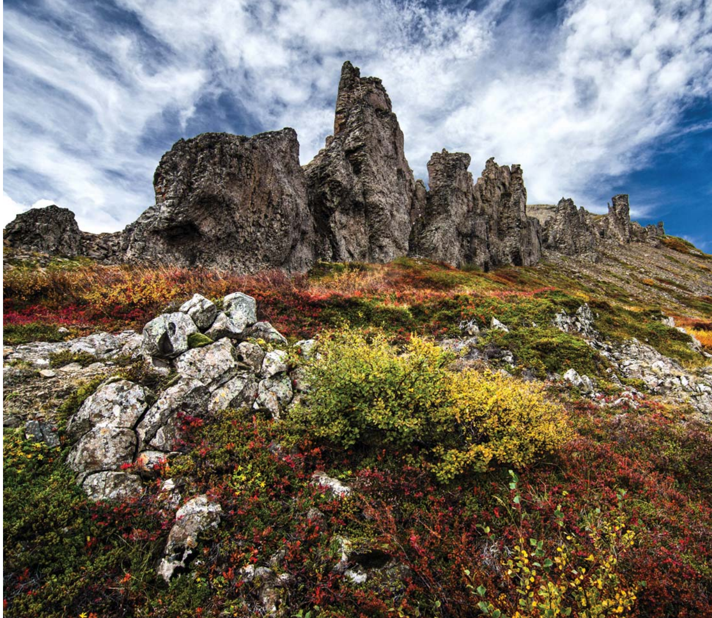
Ártindar í Dölum: Fyrsta og eina skiptið sem ég hef prófað að skipta út himni á mynd.