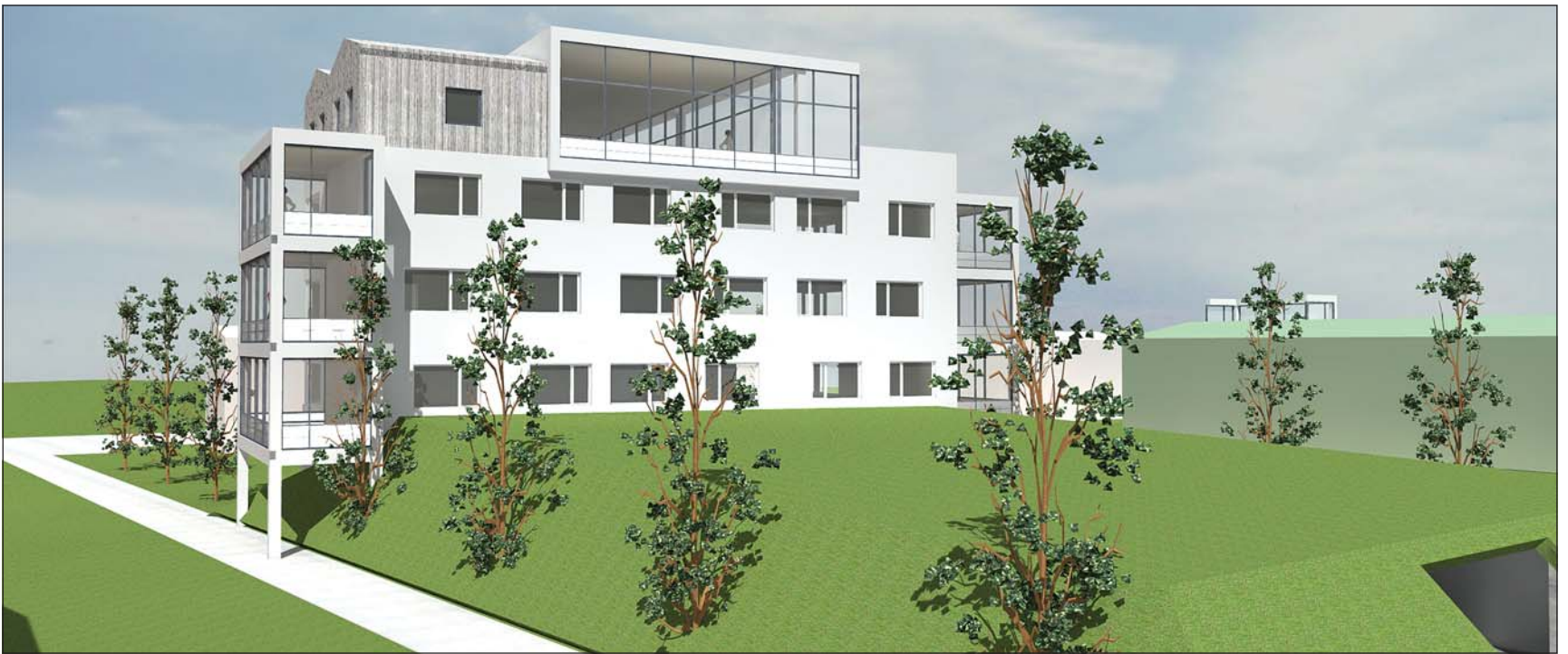
Á þessari mynd má sjá húsið ásamt bílageymslunni.