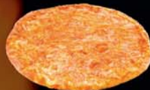
MARGARITA ostur, sósa