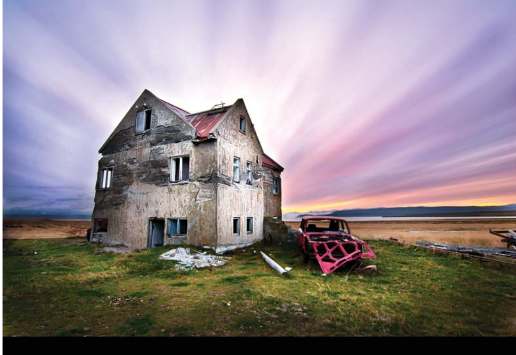
Lækjarskógur í Dölum. Dæmi um Kodak moment á himni og Photoshop framköllun.