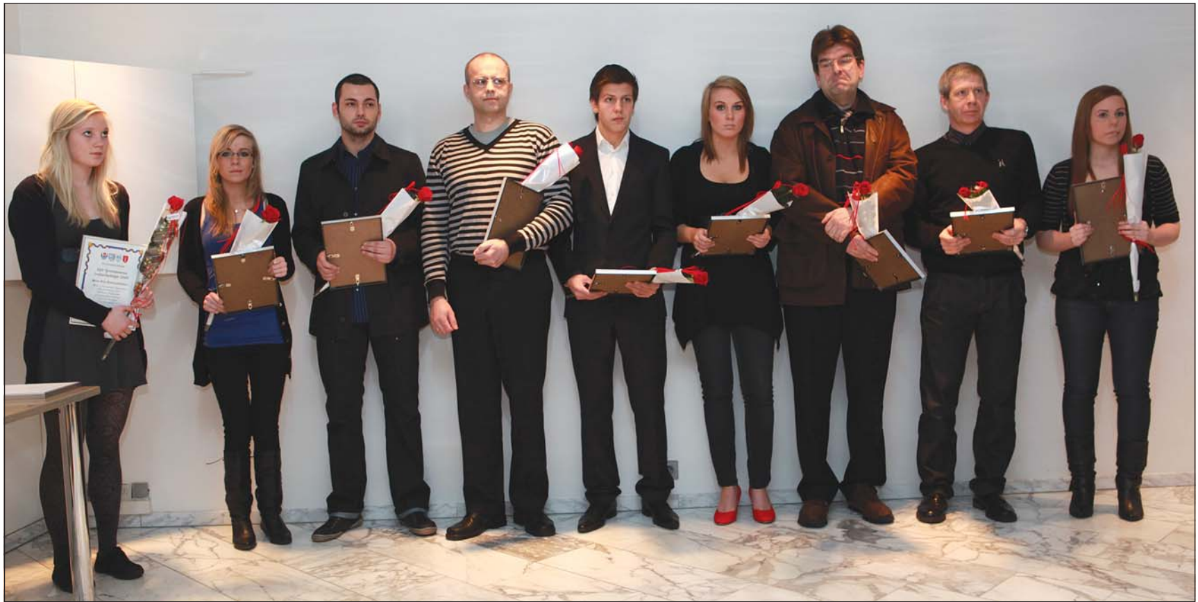
Níu tilnefningar bárust um kjör íþróttamanns ársins.