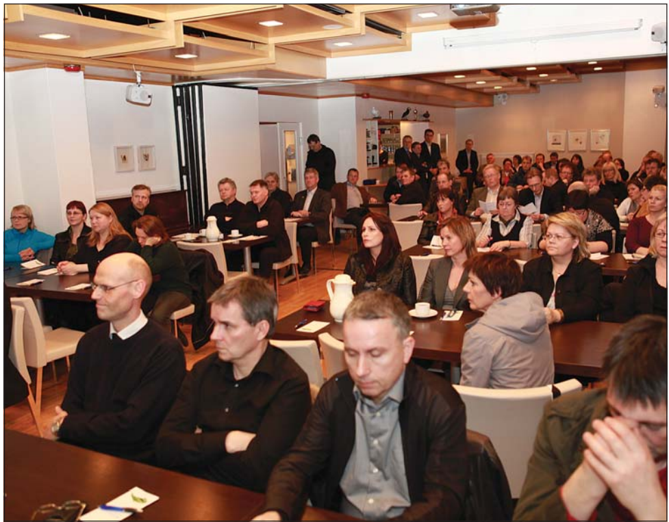
Fjöldi manns mætti á skattafund sem haldinn var á Hótel Ísafirði á föstudag.

Slökkvilið Ísafjarðarbæjar sem séð hefur um sjúkraflutninga í sveitarfélaginu í þrjá áratugi. Að sögn Marons eru samningaviðræður á lokastigi. Maron segist mjög ánægður með fyrirhugaðan samning. „Ég er mjög ánægður með að þjónustunni sé sinnt af heimamönnum og peningarnir haldist í byggðalaginu. Ég hef fulla trú á að þjónustunni verði sinnt mjög vel.“ – thelma@bb.is