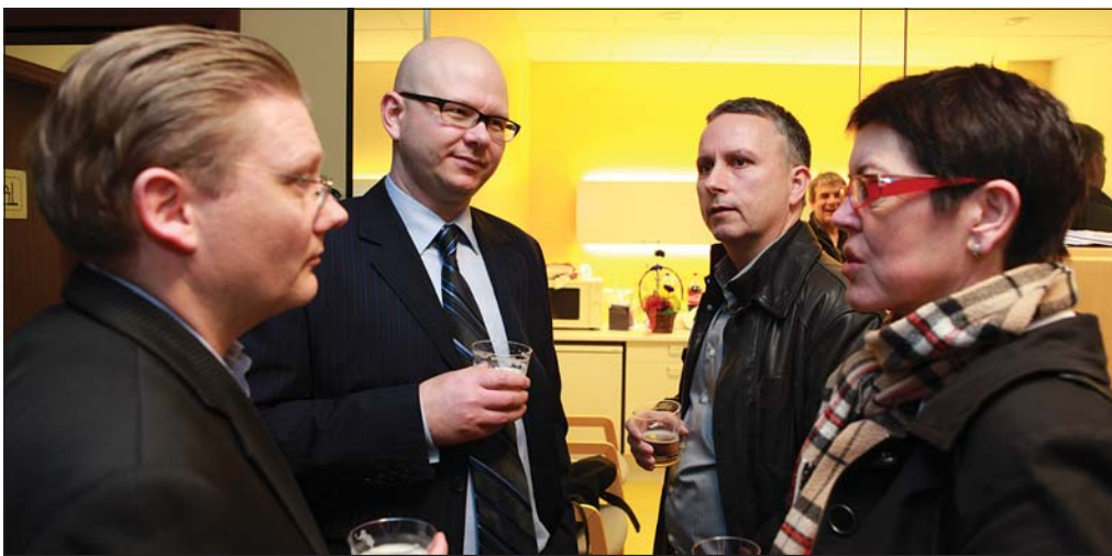
Fjöldi manns heiðraði eigendur skrifstofunnar með nærveru sinni.