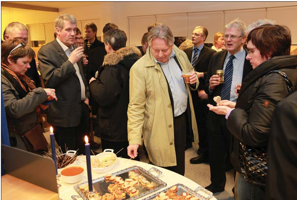
Frá opnun skrifstofu Endurskoðun Vestfjarða ehf.