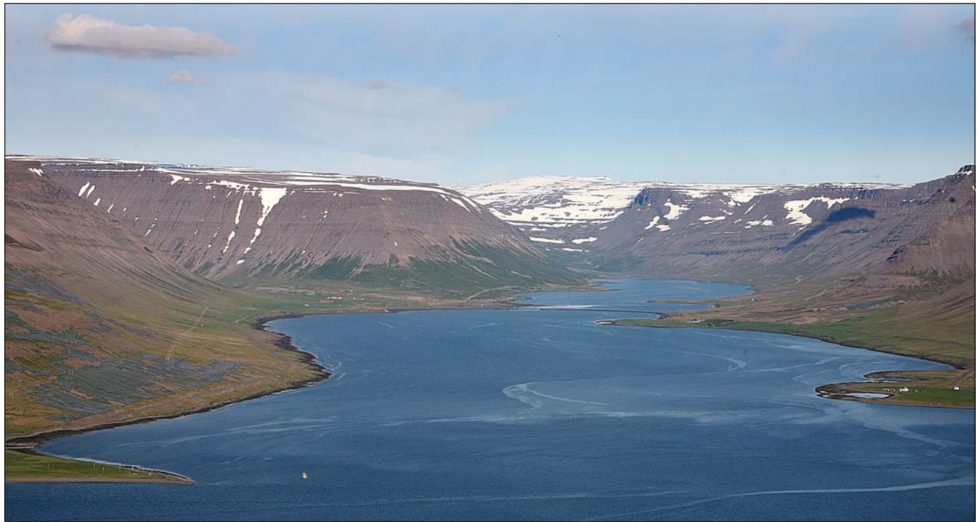
Eigendur í Hvammi í Dýrafirði vita ekki til þess að samningur varðandi nýtingu á vatni á landinu hafi verið endurnýjaður en hann rann út fyrir tæplega 33 árum.