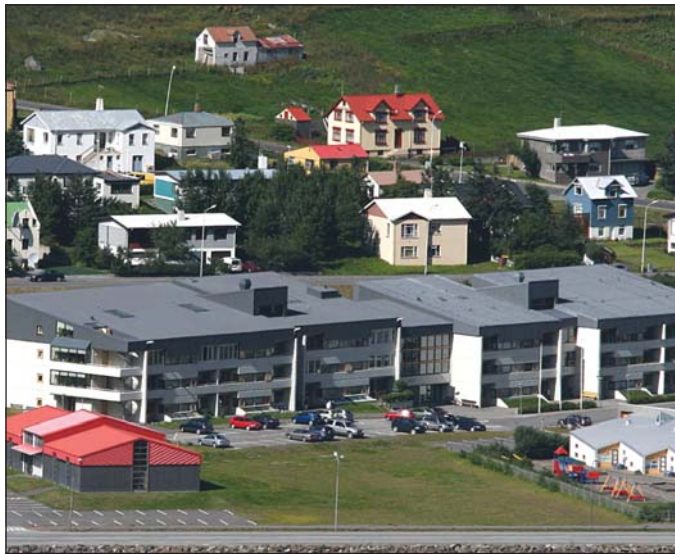
Hlíf á Ísafirði.