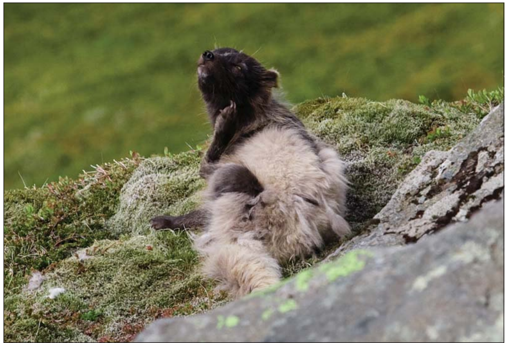
Boðið verður uppá sérstaka refaskoðunar- og rannsóknarferð í sumar.

Melrakkasetrið er fræðasetur, stofnað árið 2007 og er helgað íslenska refnum sem er eina upprunalega landspendýrið á Íslandi.