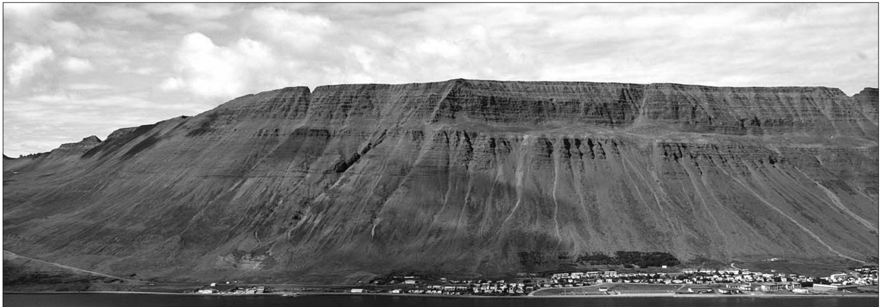
Hraunlögum hallar inn að gosbelti landsins eins og glöggt má sjá í fjallshlíðum á svæðinu segir í greinargerð með aðalskipulagsdrögum fyrir Ísafjarðarbæ.