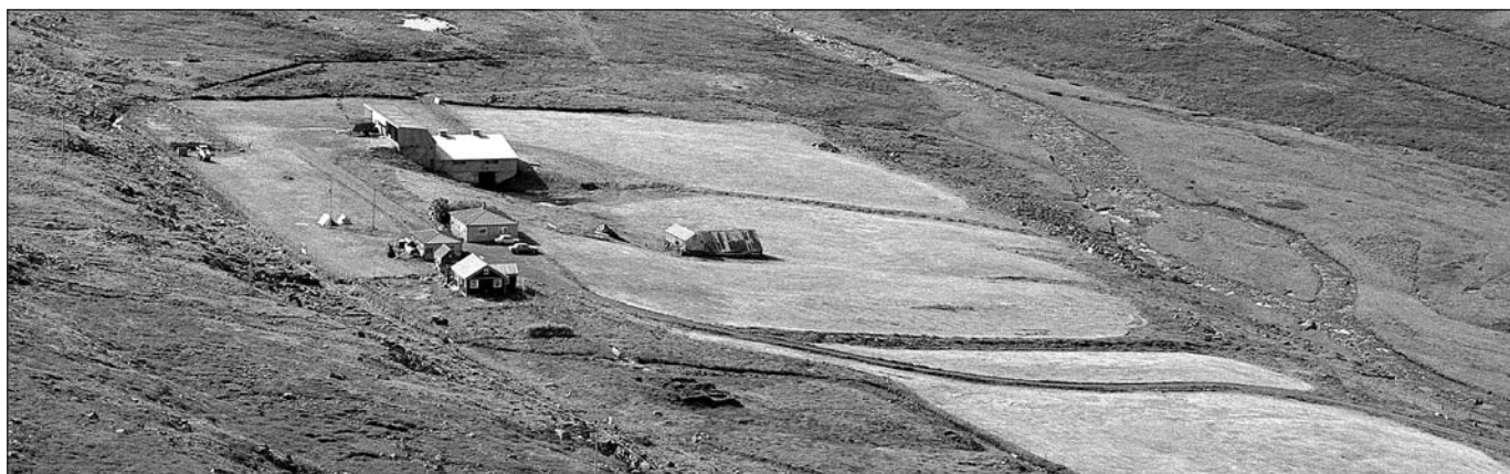
Birnustaðir í Laugardal í Ísafjarðardjúpi.

Til sölu er VW Golf árg. 1999, ekinn 184 þús. km. Upplýsingar í síma 897 4283.