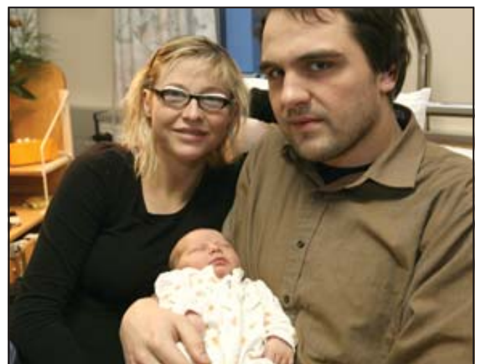
Stoltir foreldrar með drenginn sinn.