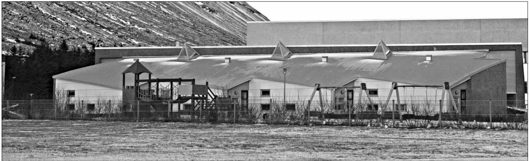
Sólborg, stærsti leikskóli Ísafjarðarbæjar.