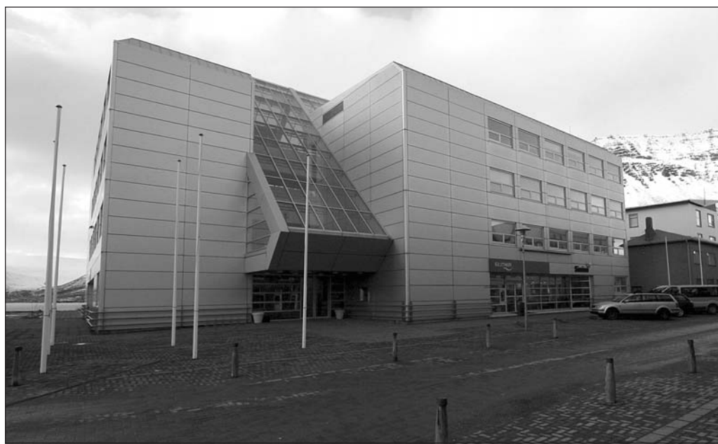
Stjórnsýsluhúsið á Ísafirði

eru algengar í fjallshlíðum. Skriðujarðvegur er algengasti jarðvegur á Vestfjörðum. Litið er um móajarðveg nema helst á heiðum og undirlendi er frekar takmarkað. Á landsvæði norðan Djúps, Hornströndum, Jökulfjörðum og Snæfjallaströnd, eru tvær fornar megineldstöðvar er hafa mótað landslag á svæðinu með fjölbreytilegum bergtegundum, berggöngum og bergstöndum. – thelma@bb.is