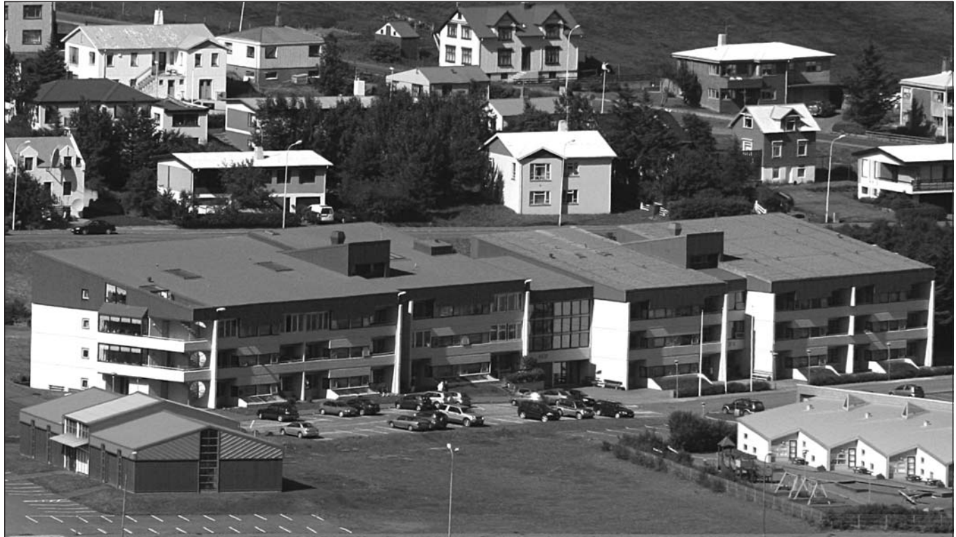
Á Hlíf á Ísafirði eru 72 íbúðir ætlaðar öldruðum.

Önnur útgáfa: Ferðablaðið Á ferð um Vestfirði. ISSN 1670 - 021X