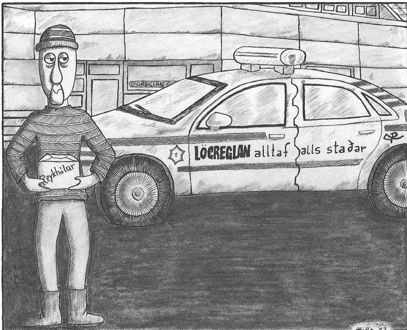
Fjórir nýir lögreglumenn til Ísafjarar. „Forkastanleg framkoma.“