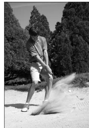
Svona golf er heilsusamlegt fyrir heyrnina.

Kannski fáum við að sjá Tiger Woods með eyrnatappa eða jafnvel heyrnarskjól eins og gröfumaður þegar hann kemur til leiks á ný. Minni þörf er samt á slíkum ráðstöfunum þegar slegið er úr sandglompu og kannski er bara heilsusamlegast að lenda sem oftast í þeim.