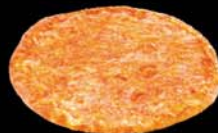
MARGARITA ostur, sósa Kr.1.550