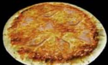
SKINKU PIZZA Kr.1.650