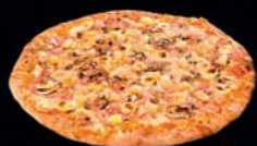
ISLAND skinka, sveppir, ananas, rjómaostur, hvítlaukur Kr.1.850