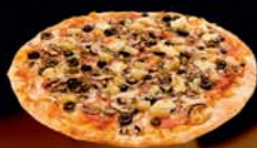
TOSCANA pepperoni, jalapeno, svartar ólífur, sveppir, ananas, hvítlaukur, origano, rjómaostur Kr.1.850