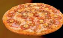
PRIMA DONNA beikon, pepperoni, skinka, rjómaostur, origano Kr.1.850

ALLAR PIZZUR Á SUPER-MEGA TILBODI ÚT JANÚAR 1.500 KR