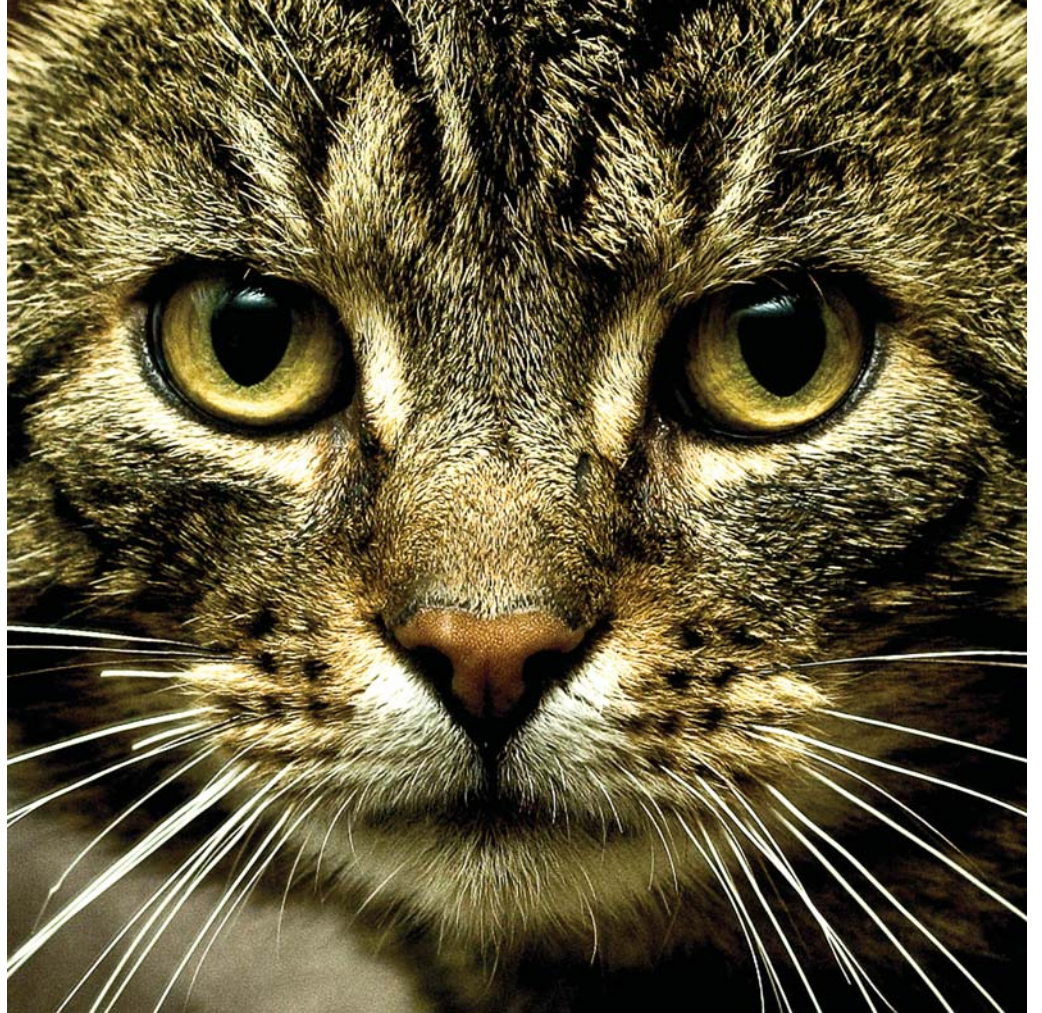
Brandur, einhver sá magnaðasti köttur sem ég hef átt.

Þeir sem hyggjast nýta sér atburðardagatalið hér að ofan er bent á að senda inn tilkynningar á bb@bb.is fyrir hádegi á mánudegi í þeirri viku sem blaðið fer í dreifingu.