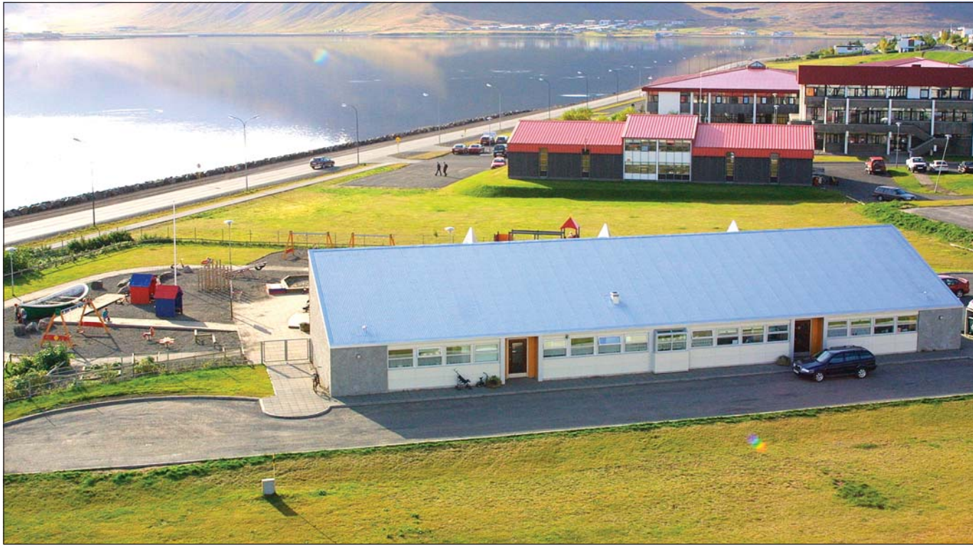
Leikskólinn Sólborg á Ísafirði.

nýsköpun. Meðan maður er að koma þessu á koppinn er erfitt að fá fjármagn í svona verkefni. Vaxtarsamningur Vestfjarða og Nýsköpunarsjóður styrkir einnig verkefnið um svipaðar upphæðir og Landsbankinn var að gera,“ segir Hálfván. Heildarkostnaður verkefnisins er áætlaður 80 milljónir króna og enn er verið að safna hlutafé. – hordur@bb.is