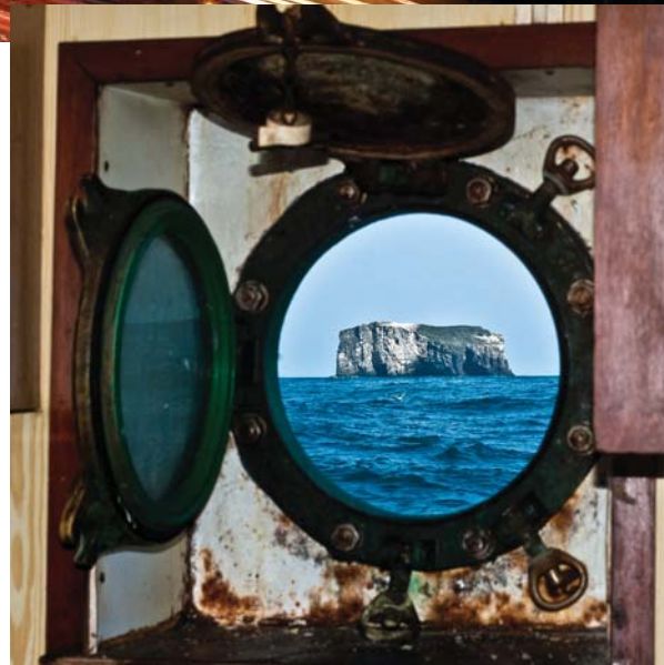
Súlnasker. Myndin er tekin í gegnum kýraugað á Fjölni SU 57.