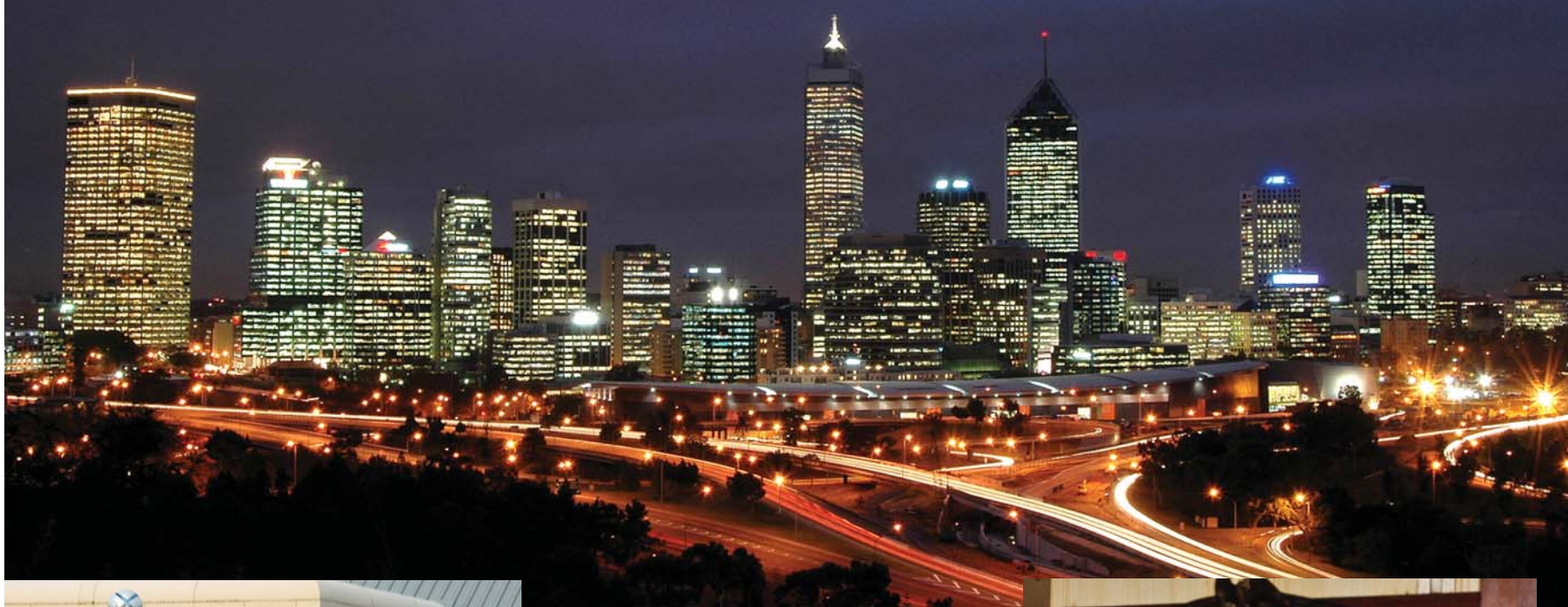
Að ofan: Perth í vestur Ástralíu þar sem ég bjó um árabil.