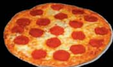
PEPPERONI PIZZA Kr.1.650