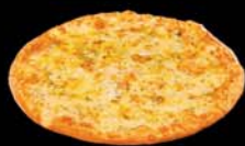
HVÍTLAUKSBRAUÐ Kr. 1.550