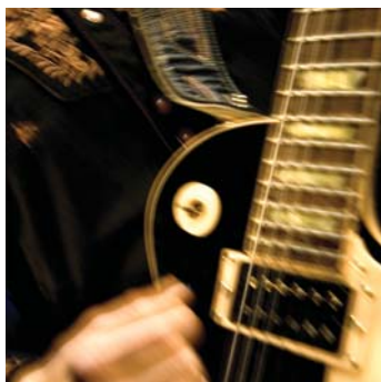
Mugison á Októberfest.