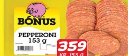
BÓNUS PEPPERONI 153 g 359 KR. 153 G