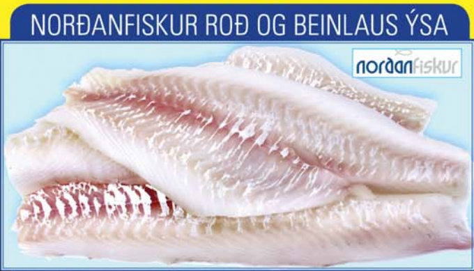
NORÐANFISKUR ROÐ OG BEINLAUS ÝSA