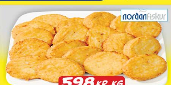
NORÐANFISKUR FROSNAR STEIKTAR FISKBOLLUR