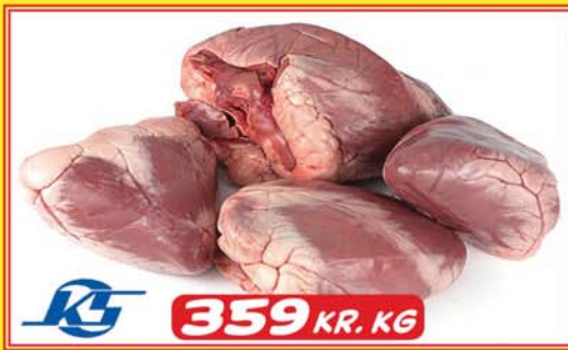
FRÁ KAUPFÉLAGI SKAGFIRÐINGA FROSIN LAMBAHJÖRTU