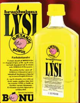
BÓNUS 498 KR. PORSKALÝSI 500ml