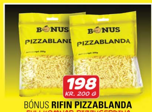
BÓNUS RIFIN PIZZABLANDA FULLKOMNAR PIZZUGERÐINA ÞÍNA HEIMA!