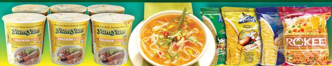
YUM YUM NÚÐLUR 70gr BOX