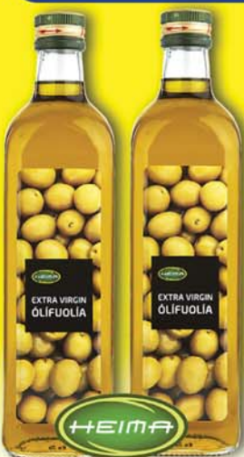
EXTRA VIRGIN ÓLÍFUOLIA 750ml 598 KR.FL