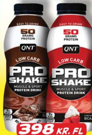
398 KR. FL

PRÓTEINDRYKKUR SUKKULADI & JARÐARBERJA 50 GRÖMM HREINT PRÓTEIN Í HVERRI FLÖSKUR