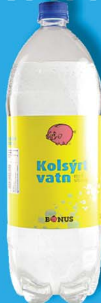
159 KR. 2 LTR.