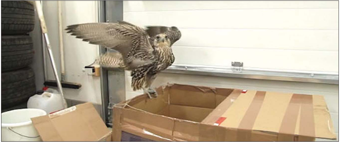
Fálkinn sem bjargað var.