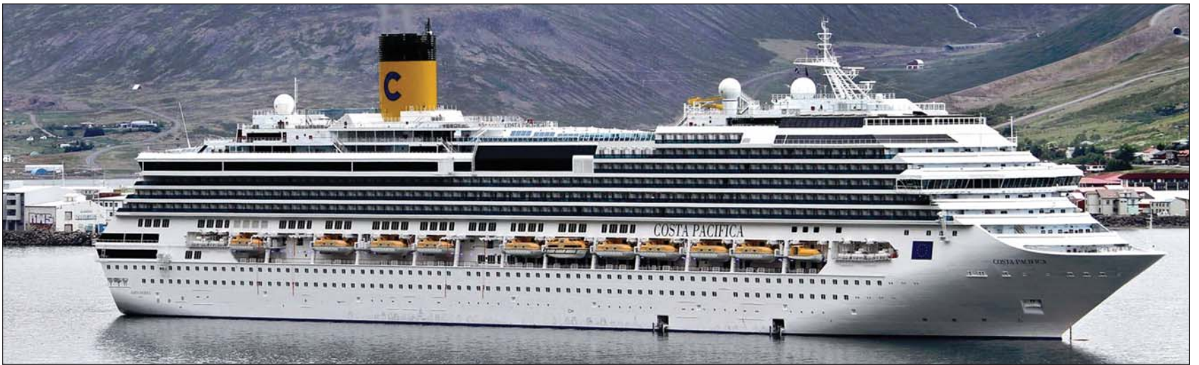
Skemmtiferðaskipið Costa Pacifica við minni Skutulsfjarðar í sumar. Áætlað er að skipið sæki Skutulsfjörðinn aftur heim næsta sumar.