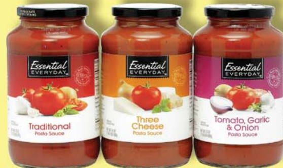
ESSENTIAL EVERYDAY AMERÍSKAR PASTASÓSUR PASTASÓSUR 680ml 198 KR.