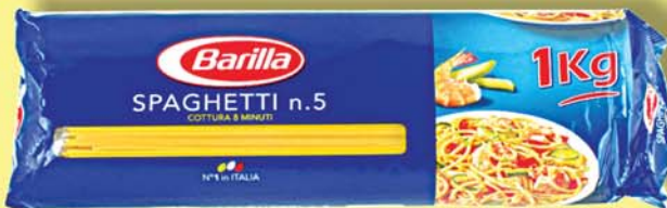
Barilla SPAGHETTI 1.KG 259 KR.