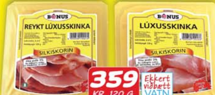
BÓNUS REYKT LÜXUSSKINKA 359 KR. 120 G BÓNUS LÜXUSSKINKA 359 KR. 120 G Ekkert viðbetta VATN