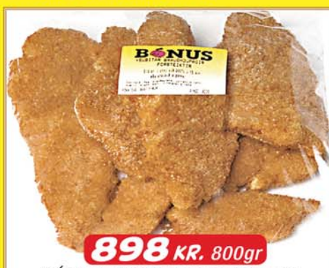
BÓNUS FROSINIR FISKBITAR Í RASPI 800 GRÖMM