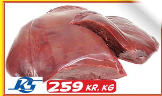
FRÁ KAUPFÉLAGI SKAGFIRÐINGA FROSIN LAMBALIFUR