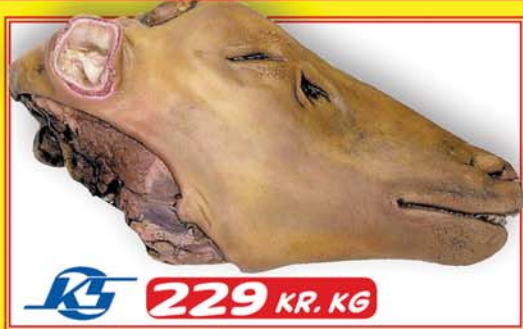
FRÁ KAUPFÉLAGI SKAGFIRÐINGA FROSIN LAMBASVIÐ