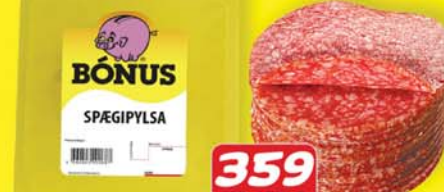
BÓNUS SPÆGIPYLSA 359 KR. 153 G